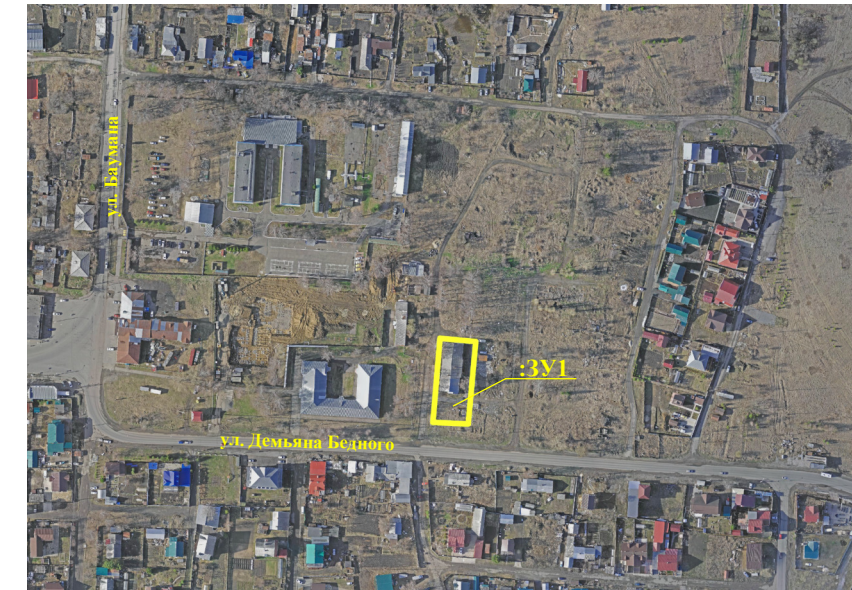
Схема подготовлена на основании сведений предоставленных филиалом публично-правовой компании "Роскадастр" по Томской области. В качестве кадастровой основы использован кадастровый план территории 70:21:0100097 от 06.04.2023г. № КВВИ-001/2023-81223194

Номенклатура планшетов масштаба 1:500 И-17-15