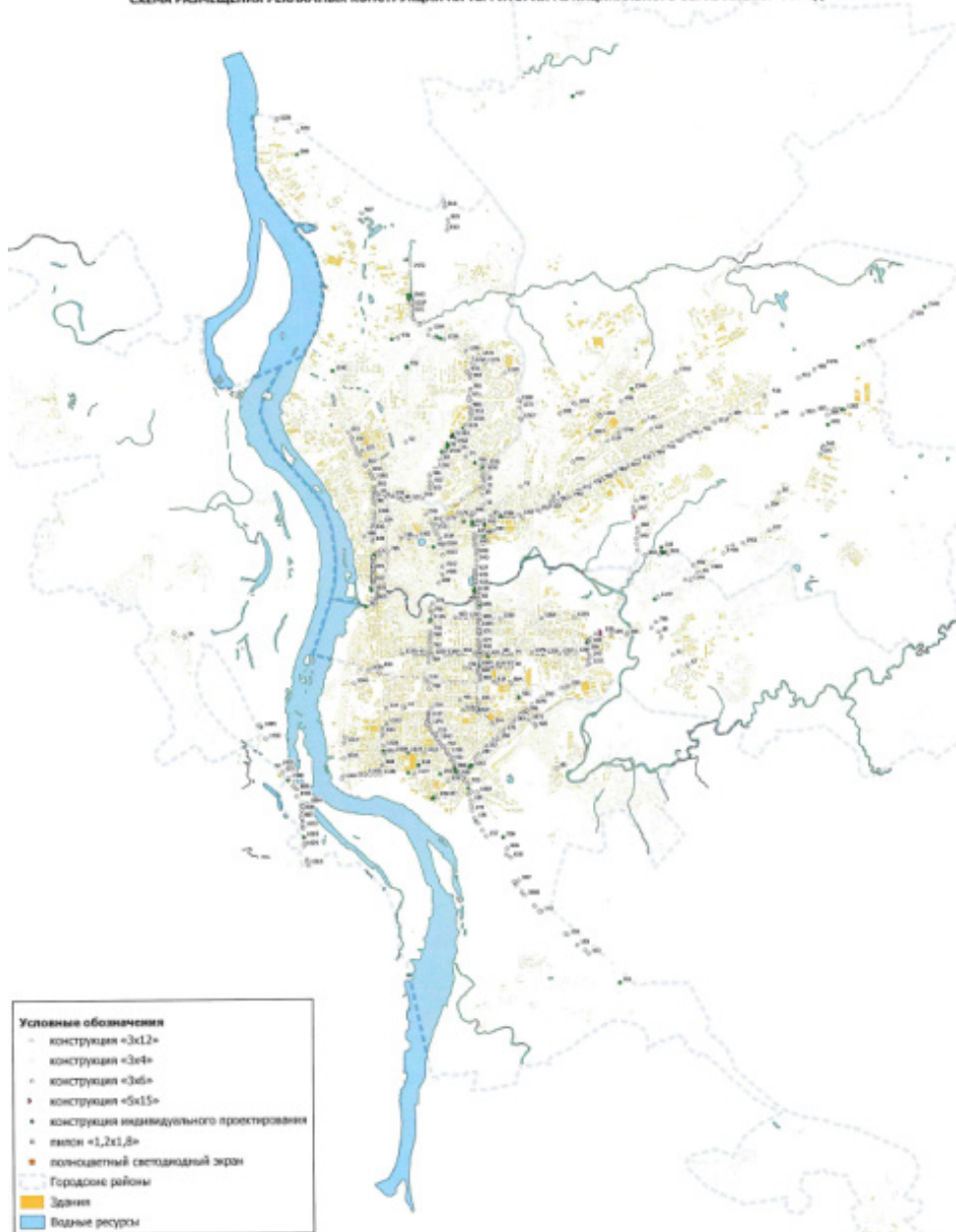
СХЕМА РАЗМЕЩЕНИЯ РЕКЛАМНЫХ КОНСТРУКЦИЙ НА ТЕРРИТОРИИ МУНИЦИПАЛЬНОГО ОБРАЗОВАНИЯ «ГОРОД ТОМСК»

Проектная и исполнительная документация Томск-Томск на 01.01.2021 г. № 576 Проектная и исполнительная документация Томск-Томск от 01.01.2021 № 11