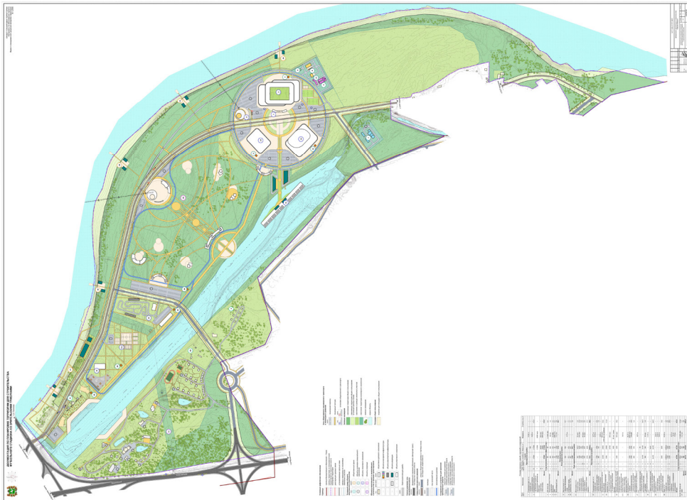
Архитектурно-проектное бюро «АрхАрхитектур»