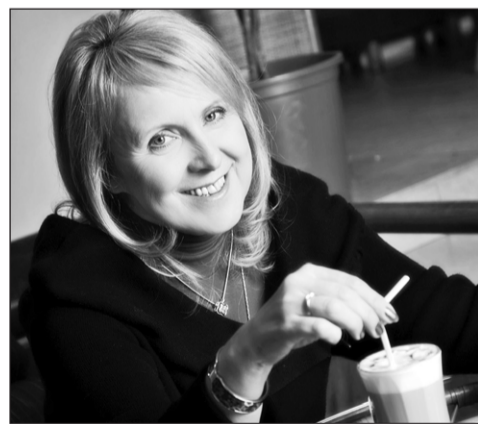
Елена Ивановна Григорьева, вице-президент Союза архитекторов России.

Понятие «общественное пространство» не имеет чётких ограничений, и многими трактуется как свободное пространство, территория массового посещения, скопления, нахождения людей, проходящих транзитом или специально посещающих эти места. В градостроительстве общественными территориями считаются парки, площади, тротуары, набережные, дворы, проходы между зданиями, специально созданные площадки, будь-то арт-площадки или уличные спортивные.