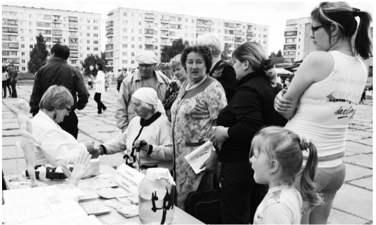
На «Ярмарке здоровья» в Светлом