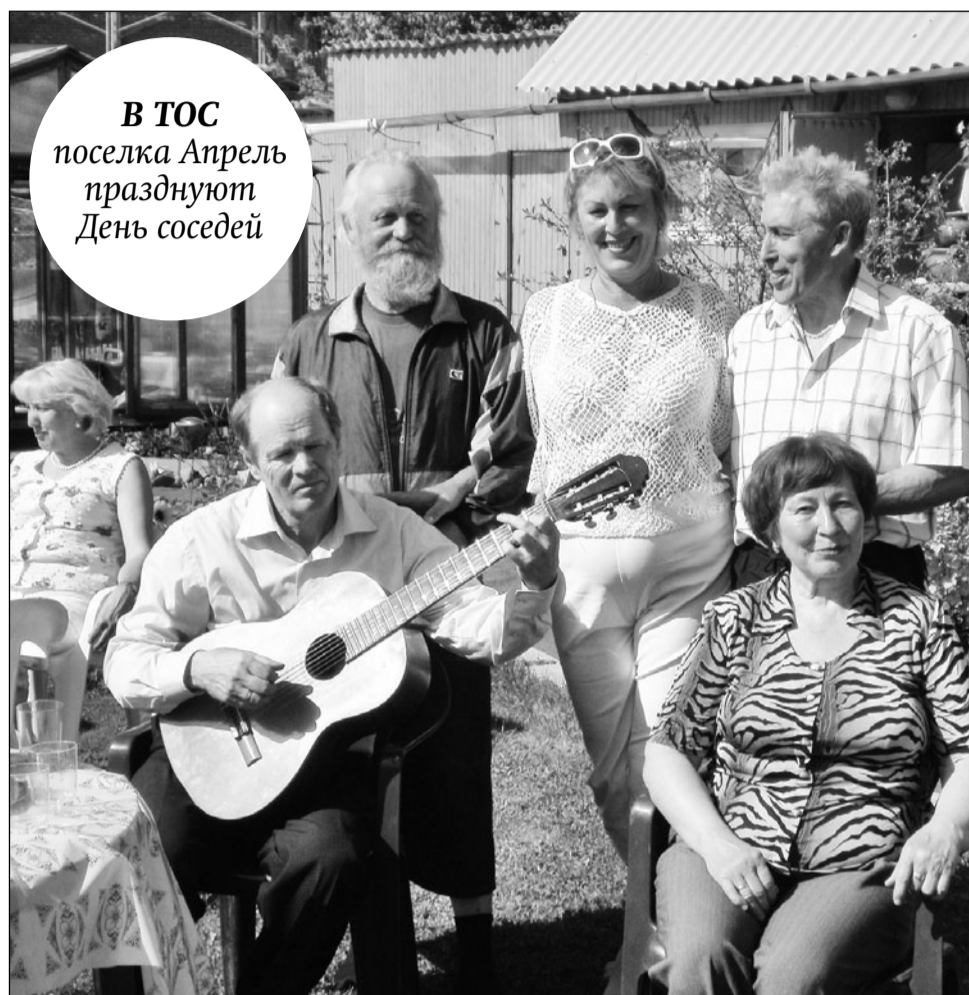
В ТОС поселка Апрель празднуют День соседей

Еще одно направление развития ТОСов – домовые комитеты. В этом случае люди организуются внутри дома, двора, чтобы контролировать деятельность управляющей компании и самим потрудиться на благо своего дома и двора. Традиционными становятся установки новогодних елок, детские утренники, общие праздники, совместные субботники и другие мероприятия. ■