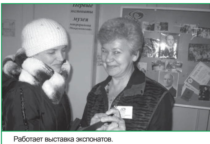
Работает выставка экспонатов.