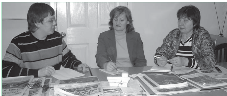
На снимке: в ресурсном центре для некоммерческих организаций при комитете по местному самоуправлению администрации города Томска (пр. Фрунзе, 3, каб. 9) осуществляется юридическое консультирование товариществ собственников жилья.

Собственникам жилья паспорт предоставит возможность внести свои предложения о том, что необходимо отремонтировать в доме, а также изучить полный перечень услуг и работ, выполненных управляющей компанией.