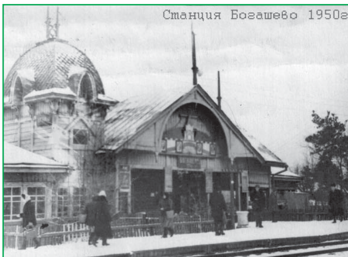
Станция Богашево 1950г