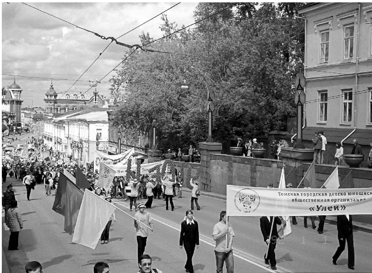
■ Томская городская детско-юношеская организация «Улей» (один из победителей муниципального гранта) на шествии, посвященном Дню согласия и примирения

Поэтому не стоит спорить о «цене вопроса», гораздо важнее то, что конкурс состоялся. Состоялся уже в шестой раз и количество участников в нем отнюдь не уменьшается, выигранные по гранту суммы растут, а проекты, по мнению конкурсной комиссии, становятся все более актуальными, конкретными и содержательными.