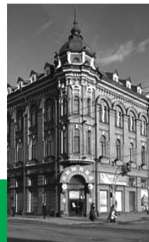
ГРАФИК ПРИЕМА ДЕПУТАТОВ НА ДЕКАБРЬ