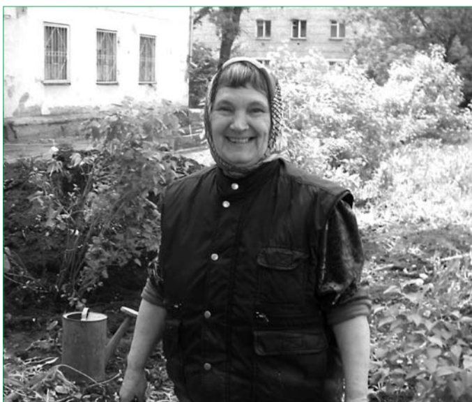
На благоустройство микрорайона вышли и стар, и млад

На снимках: во дворе дома по ул. Партизанской, 5