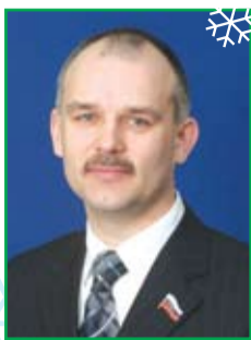
Игорь Соколовский, депутат Думы города Томска, председатель комитета по науке, вузам и инновациям

– Новый год – праздник особенный, домашний и теплый. Как вы его традиционно встречаете?