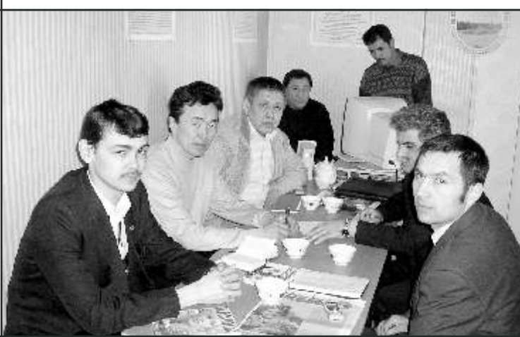
● Оргкомитет подготовки празднования Навруза в ДК «Авангард».

Томские национальные центры отпраздновали Навруз вместе