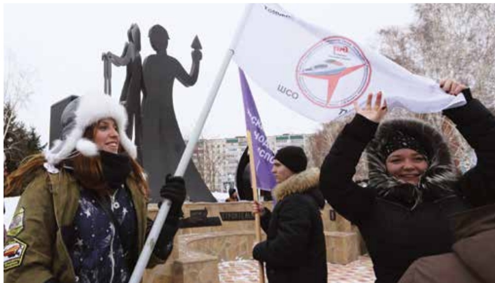
В «Снежной вахте» участвуют самые активные и отзывчивые студенты Томска

Организаторы конкурса – городское управление молодежной политики и Томское региональное отделение Российских студенческих отрядов – вряд ли ожидали, что участников будет так много. Для сравнения: в прошлом году в составе 24 команд трудились более 300 ребят. В общей сложности за время конкурса они убрали 235 объектов, в том числе 87 дворов ветеранов Ве-