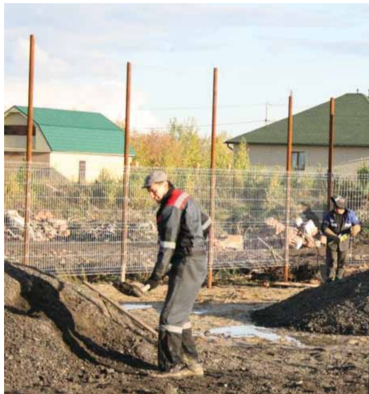
Будущая спортивная площадка в микрорайоне Науна приобретает реальные очертания