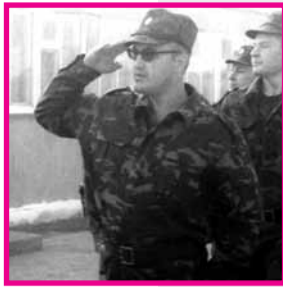
Защитник Отечества со скальпелем в руках