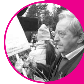
Через 73 года семья нашла место последнего боя и могилу родного человека