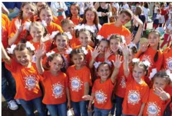
Диво-дети в Диво-городе