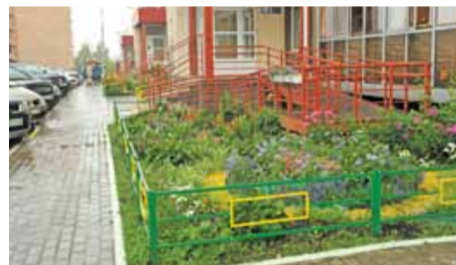
Жители микрорайона Нефтяного все лето любят свои цветники