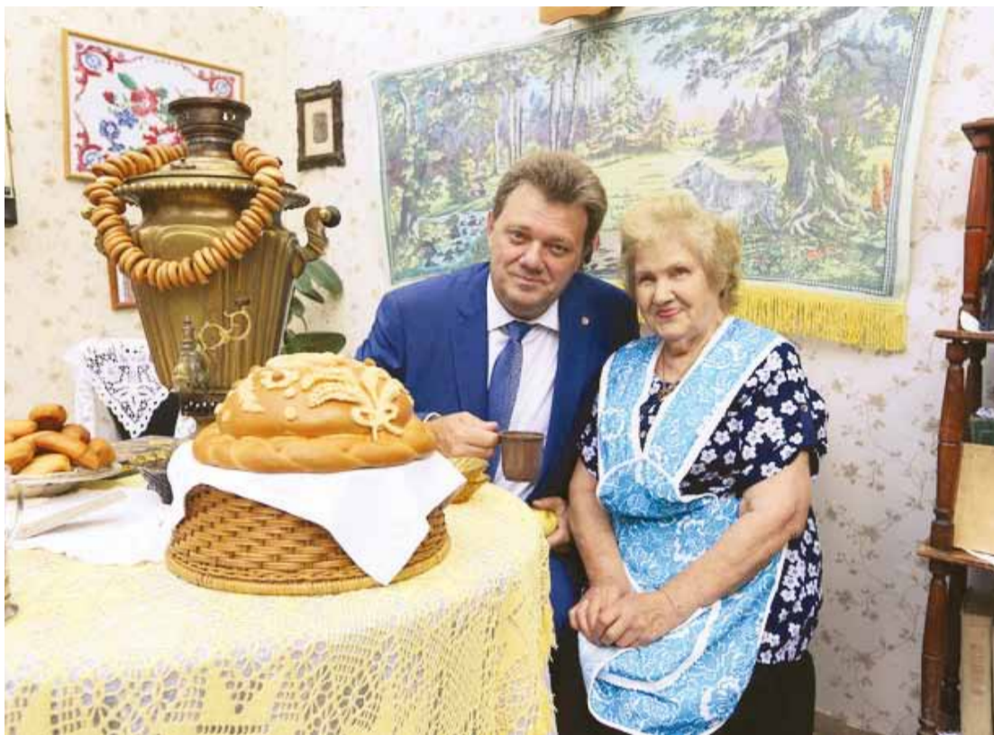
Для мэра города у томичей всегда готов пышный каравай