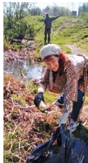
Пруды на ул. Сибирской, 104/4, очищенные во время субботника, станут центром общественного пространства