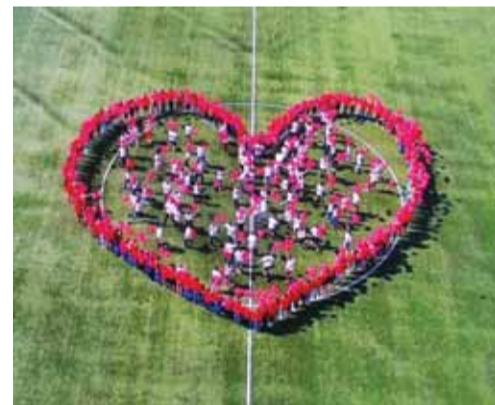
Во флэшмобе участвовали более пятисот томичей

города: кавер-группа Katy Island, театр фольклора «Разноцветье», ансамбли «Авангард», «Русские забавы», «Даймохк», «Фаэтон», «Кубалляк», «Айнур», «Самульнори», «Умид», «Союз армян», «Томские цыгане» и индейцы из Южной Америки.