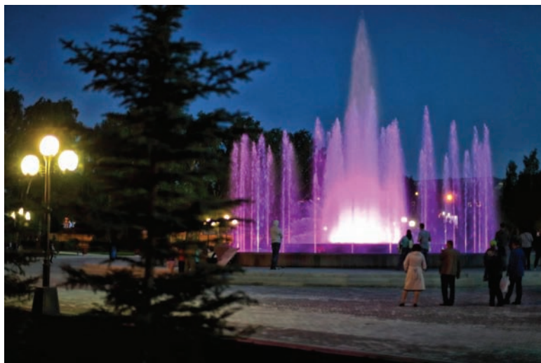
Фонтан молодости в Сквере студенческих строительных отрядов давно стал местом притяжения томичей

Звучат и критические замечания. Отдельные граждане скептически оценивают изменения. Но это тоже один из моментов мониторинга работы власти. Я нормально отношусь к конструктивной критике, она позволяет услышать нюансы и скорректировать действия. Кстати, для того чтобы слышать и быть услышанными, сегодня сформировано несколько советов при мэре, члены которых работают на общественных началах и занимаются обсуждением самых значимых проблем. Это один из эффективных способов обратной связи. Сегодня это Палата общественности, совет по развитию общественных пространств и совет старейшин. В их состав входят опытные, значимые и уважаемые люди, которые очень тщательно следят за всем, что делает муниципалитет на своей территории. ►