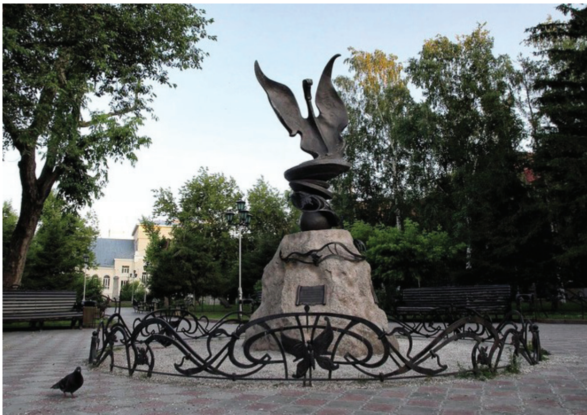
В улучшение городской среды томский бизнес вкладывает миллионы рублей

Но по количеству проголосовавших и по количеству добавленных на карту дорог мы лидеры. Цифры говорят о том, что томичи активно болеют за благополучие региона. Это видно и по опросам, которые постоянно проводятся на сайте МО «Город Томск». «Народный» опросник позволяет нам четко определять приоритеты дорожного ремонта, совместно формировать перечень улиц, которые требуют принятия безотлагательных мер. Ежегодно на ремонт дорожного полотна выделялось не менее 300 миллионов рублей.