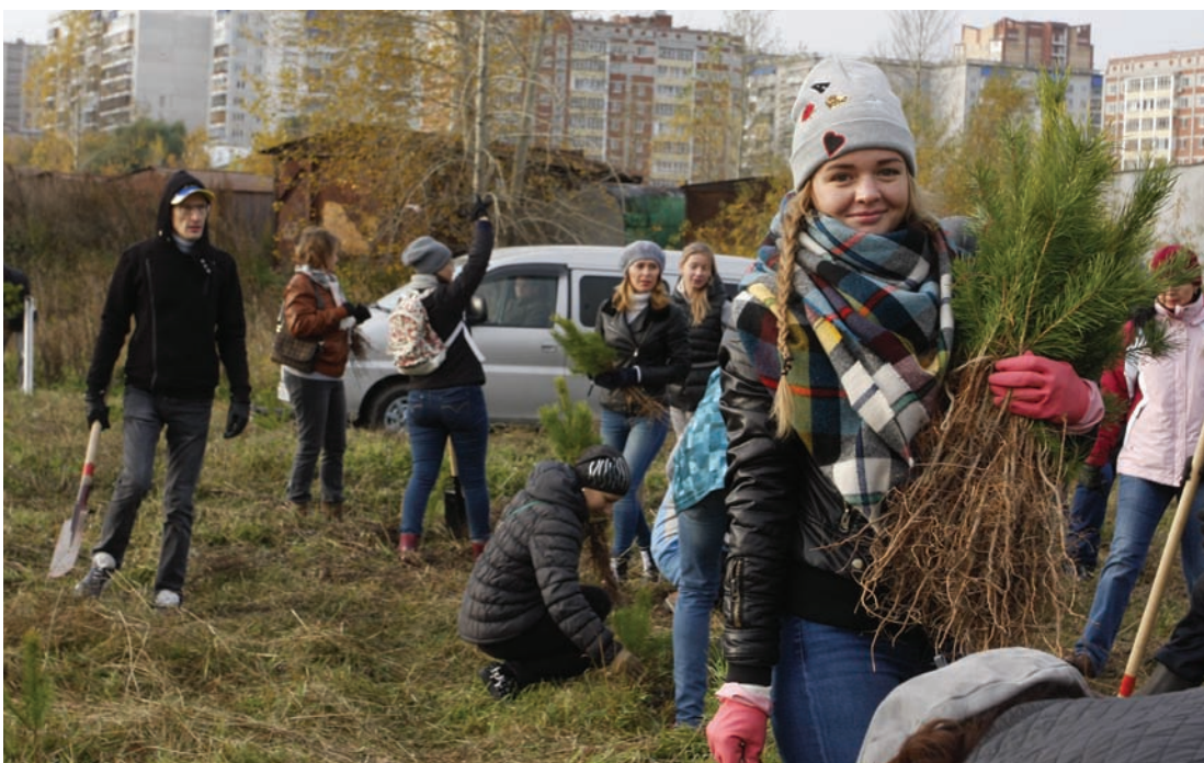
Озеленение бывшего золоотвала площадью 6,5 га прошло по просьбе и с участием горожан, здесь высажено 7 тысяч сеянцев сосны

– Если каждый человек выйдет на полчаса и сделает какое-то полезное дело, город станет хоть чуть-чуть,