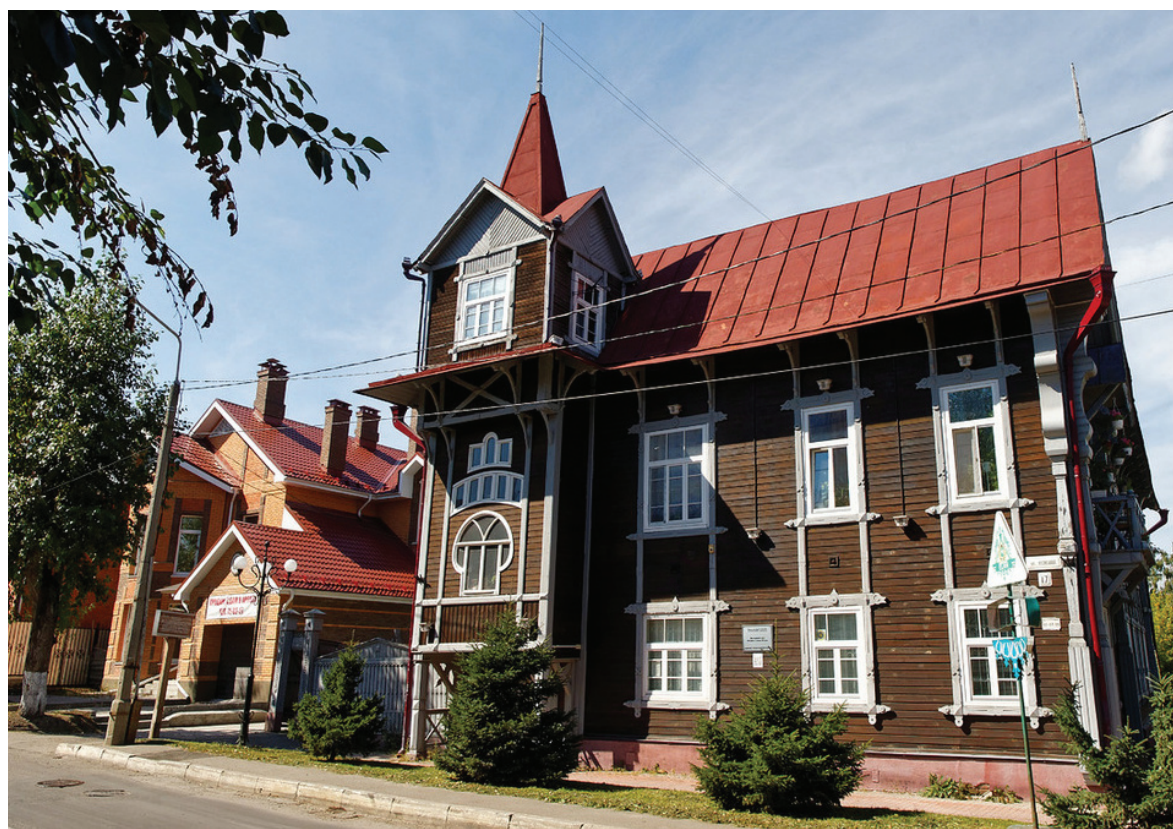
Томск признан самым благоустроенным среди городов Сибири

С членами советов мы регулярно обсуждаем проблемы, планы, эскизы будущих проектов. И то, что сегодня Томск признан самым комфортным для проживания городом в Сибири, – это большой задел на будущее.