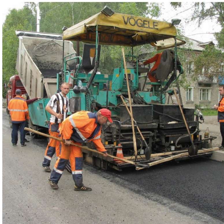
В Томске не упустили шанс для проведения масштабной и качественной ремонтной кампании на улично-дорожной сети

Кстати, есть и то, что из левой точки уже перешло в выздоравливающую. В слож-