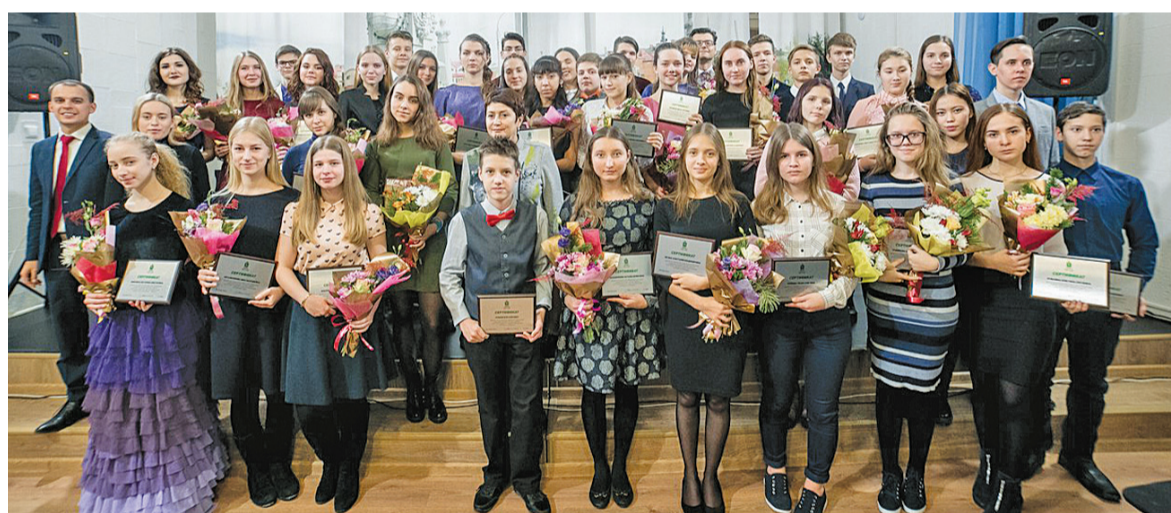
С такой молодежью, как именные стипендиаты городской администрации, можно смело говорить, что у Томска отличное будущее!

Но главными на этом торжестве были все-таки стипендиаты. Несмотря на юный возраст, каждый из них добился немалых успехов. Добился не только благодаря таланту, но и усердию, целеустремленности, трудолюбию, настойчивости, старанию.