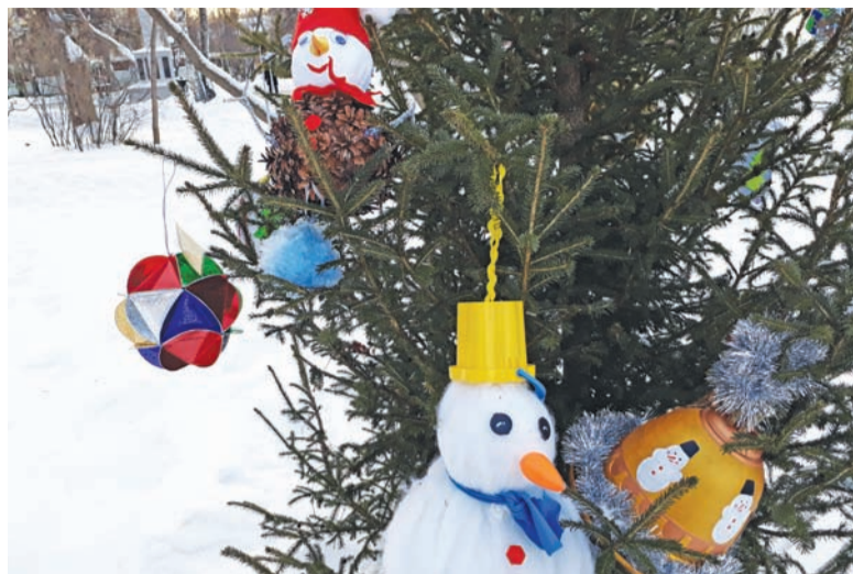
Новогодние игрушки, сделанные детьми, украсили молодые ели и кедры на Новособорной площади

– Игрушки, выполненные руками юных томичей, все яркие, креативные – самый лучший подарок для любимого города. Они привнесли ноту очарования в облик Новособорной площади и наполнили