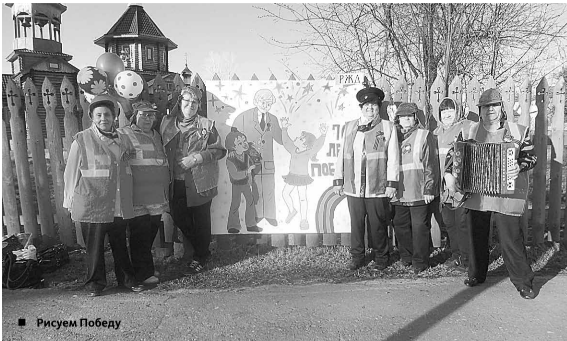
■ Рисуем Победу

В Верхнекетском районе работают 22 первичные ветеранские организации, в том числе 8 – в сельских поселениях. Так, уже третий год действует первичка работников железной дороги, одна из ярких и самобытных. 11 женщин-активисток удивительно молодых и задорных. Это не просто первичка – это вокальный ансамбль «Надежда». У них не просто репетиции, здесь свой особый мир словно родных людей – со своими традициями, с дружескими посиделками в дни рождений, с чаепитиями и бесконечными разговорами «про жизнь». Ни одно событие для жителей станции не проходит без участия этих женщин. И каждый концерт, словно праздник, когда в зале яблоку негде упасть, а собираются и стар, и млад, и дети. Особенно любят здесь Масленицу и 9 мая.