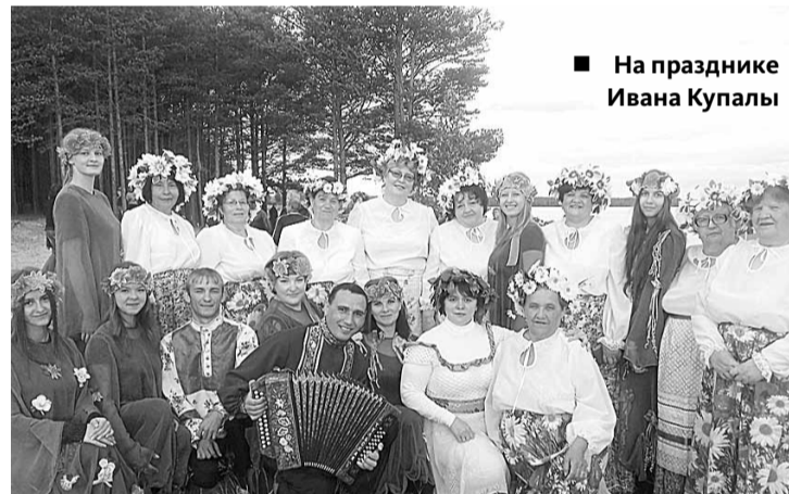
■ На празднике Ивана Купалы

Станция Белый Яр – это почти тысяча жителей в пяти километрах от райцентра, который носит то же имя. В 1967 году строительство дороги Асино – Белый Яр было объявлено Всесоюзной комсомольской стройкой. И поехали строить комсомольцы! Кемеровская, Новосибирская, Тамбовская и другие области. Услышали по радио, прибыли по комсомольским путёвкам, по направлениям после учёбы. С улыбкой вспоминали мои собеседницы: узкоколейка, вагончики вместо домов. Ни бани, ни клуба, ни школы. Дети, школьники на всю неделю отправлялись в интернат в Белый Яр. Но люди быстро обжились, подружились. Жили трудно, но весело. Все праздники – только вместе. Так было до 90-х годов. Общие радости, общие беды и