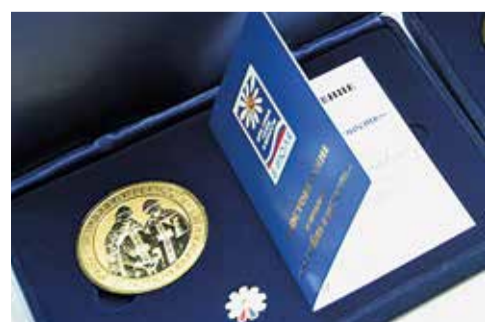
Медаль «За любовь и верность» вручается супружеским парам с 2008 года