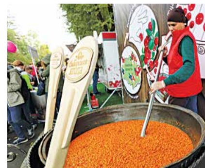
Томские пищевики сварили 225 литров варенья в одном чане. Это был рекорд Дня томича – 2016