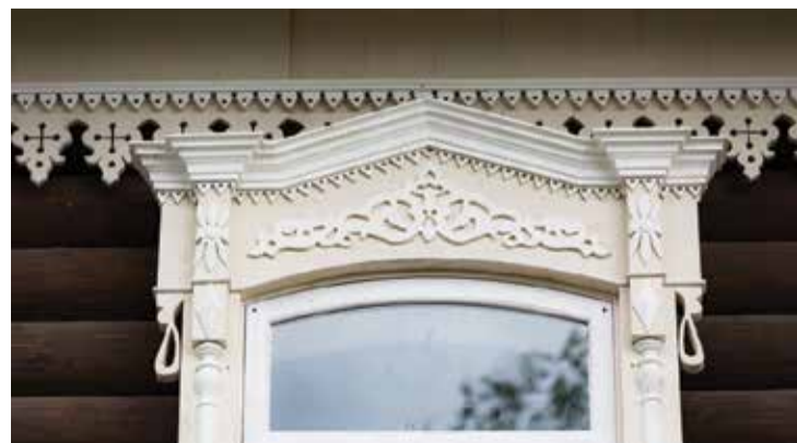
В доме по ул. Пушкина, 5, удалось создать точную копию наличников, которые ранее обрамляли окна этого дома

В общей сложности фирма вложит в реставрацию около 17 млн рублей. Завершить работы планируется в 2019 году, чтобы дать деревянному дому осесть.