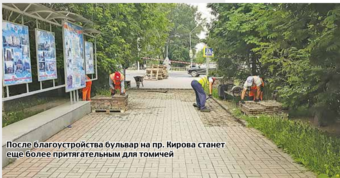
После благоустройства бульвар на пр. Кирова станет еще более притягательным для томичей

Забыли томичи о том, как бури вырывают тополя с корнем, нанося большие беды. У тополей неглубокая корневая система, и чем выше тополь, тем выше смещается его центр тяжести, и ураган делает свое коварное дело.