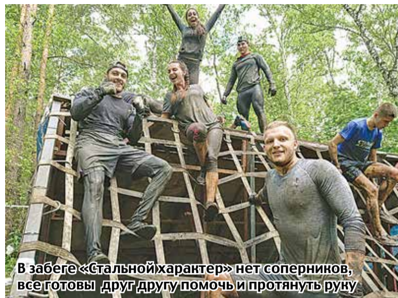
В забеге «Стальной характер» нет соперников, все готовы друг другу помочь и протянуть руку

Также томичам предстояло с мешком песка в руках забраться по склону, с помощью каната перебраться через высокую стену. А вот на четырехметровый наклонный трамплин участники карабкались уже без подручных средств – рассчитывая только на себя и своих товарищей. Спрыгнуть с трамплина предстояло в холодный бассейн с водой и грязью. Яма