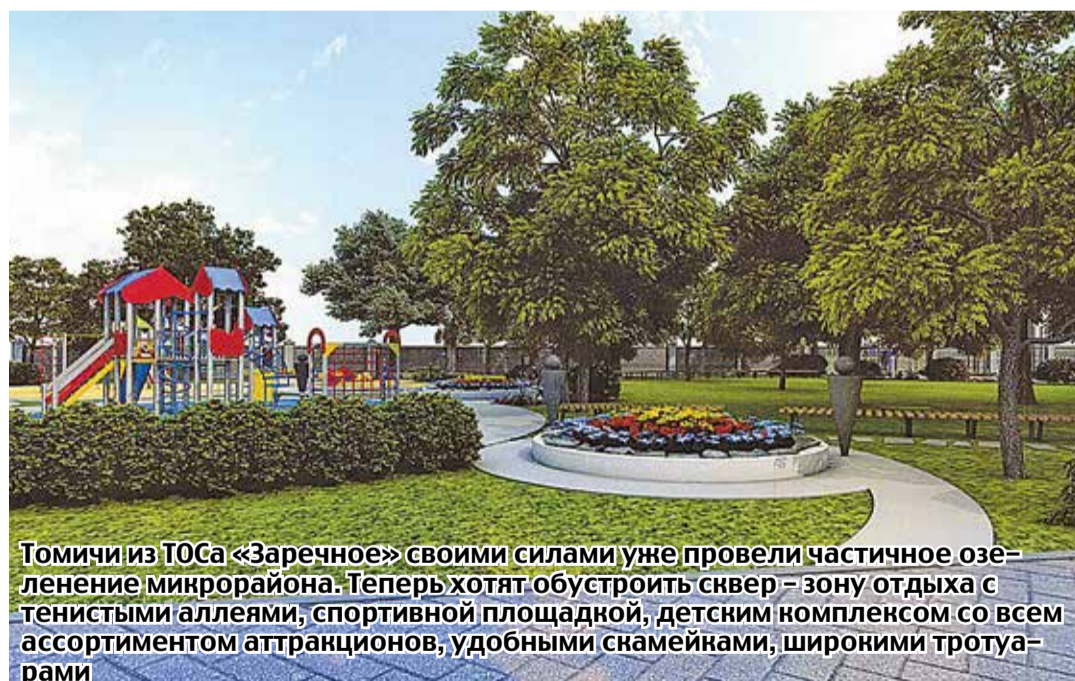
Томичи из ТОСа «Заречное» своими силами уже провели частичное озеленение микрорайона. Теперь хотят обустроить север – зону отдыха с тенистыми аллеями, спортивной площадкой, детским комплексом со всем ассортиментом аттракционов, удобными скамейками, широкими тротуарами

Материалы полосы подготовила Нина Счастливая