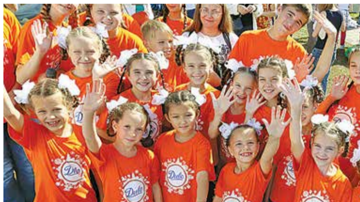
По традиции праздник маленьким томичам дарит ОАО «Томское пиво»

В День томича работают 60 площадок – развлекательных, спортивных, познавательных