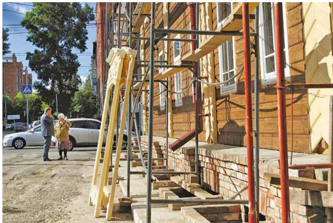
При реставрации дома по пр. Фрунзе, 32а, удалось сохранить значительную часть подлинных бревен

Инвесторы восстанавливают исторический облик города