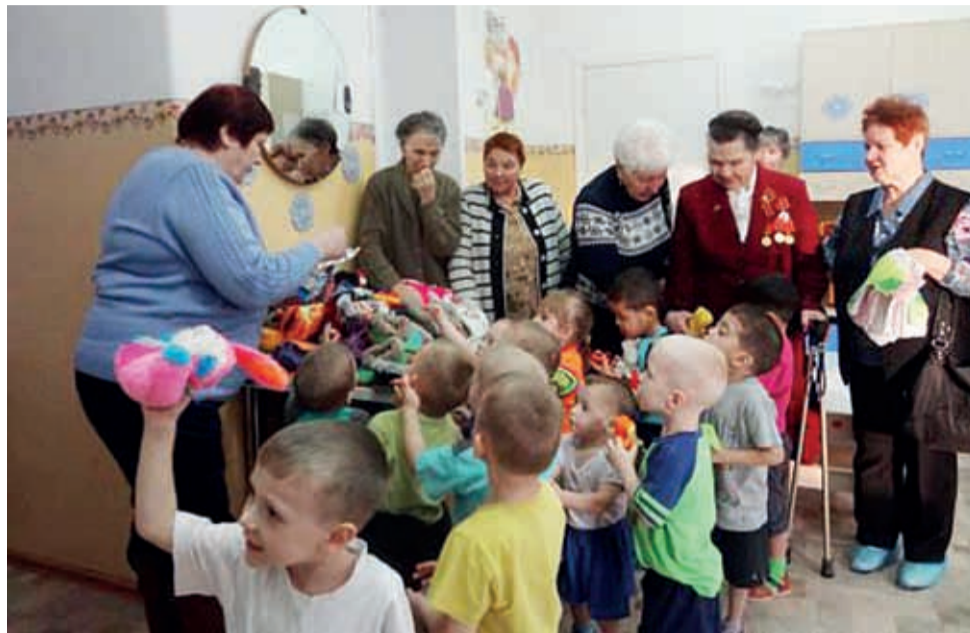
Мастерицы-вязальщицы из ТОСа «Совет квартала «Авангард» в доме ребенка

вторых, они реально помогают своим творчеством детям, лишенным семьи.