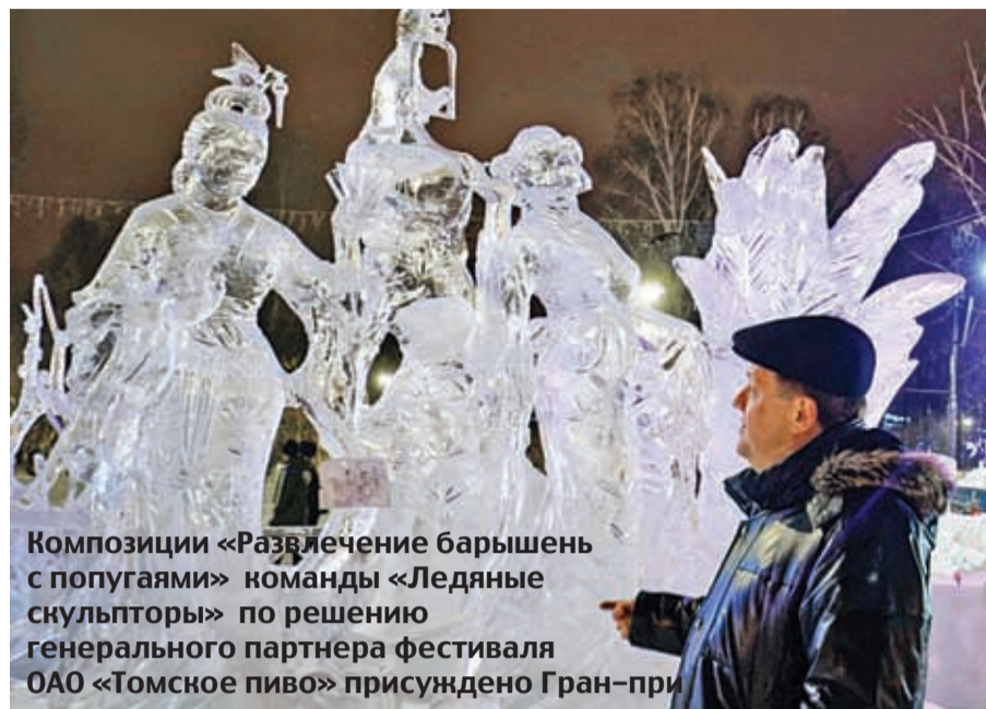
Композиции «Развлечение барышень с попугаями» команды «Ледяные скульпторы» по решению генерального партнера фестиваля ОАО «Томское пиво» присуждено Гран-при

Гости праздника увидели выступление новогоднего хора, номера танцевальных коллективов и барабанщиков. На большом экране у сцены шла трансляция видеопоздравлений. А вскоре одновременно зажглась вся городская новогодняя иллюминация, отчего Томск засиял торжественно и живописно. Завершился праздник большой дискотеккой с участием DJ и световым шоу на главной