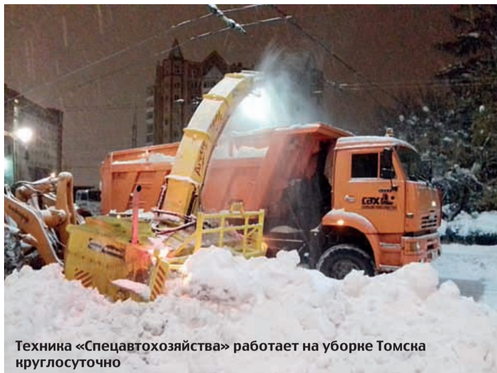
Техника «Спецавтохозяйства» работает на уборке Томска круглосуточно