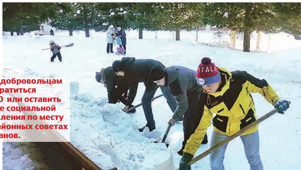
Волонтеры помогают убирать снег в частном секторе и на территории общественных пространств

За помощью к добровольцам можно обратиться по тел. 65-70-40 или оставить заявку в центре социальной поддержки населения по месту жительства и в районных советах ветеранов.