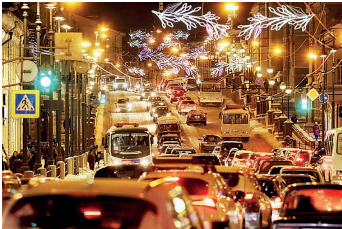
Томск в ожидании Нового года

А пока я хочу еще раз поздравить всех томичей с наступающим Новым годом и пригласить на новогодний фейерверк и мероприятия, которые будут проходить с 1 по 8 января на площади Новособорной и в других ледовых городках.