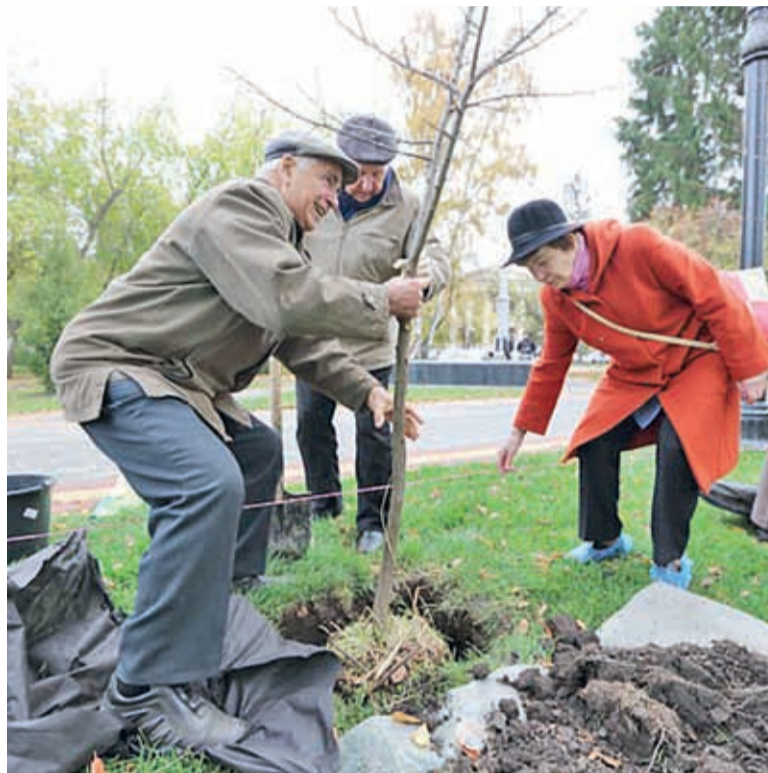
Члены Совета старейшин сажают яблоневую аллею на Новособорной площади

Совет старейшин всегда обращается к тем проблемам, ко-