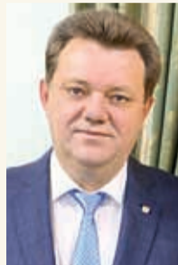
Мэр Томска Иван Кляйн

Мы отремонтировали 33 улицы, благоустроили десятки общественных пространств. Новый облик обрели знаковые для всех нас территории: проспект Кирова, Лагерный сад и Михайловская роща.