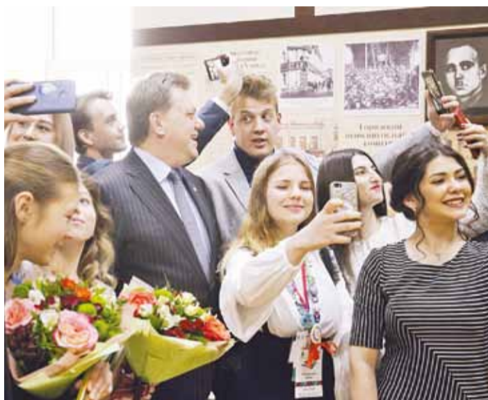
Селфи с мэром

Студенческий Томск отпраздновал Татьянин день