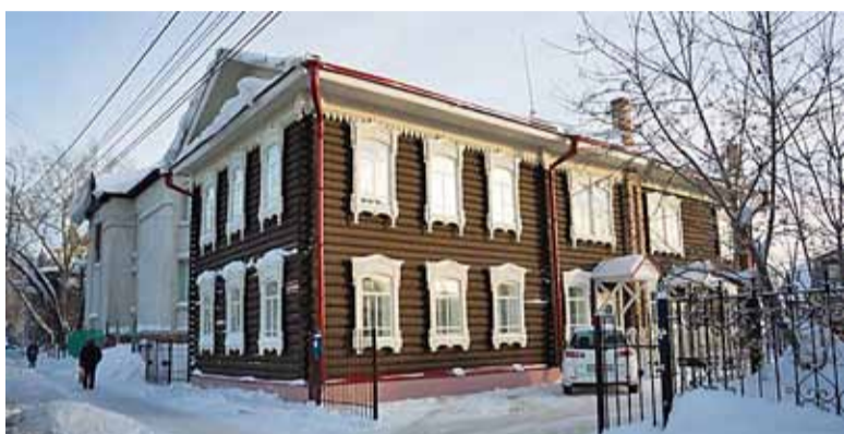
В доме по ул. Пушкина, 5, уже работают несколько офисов