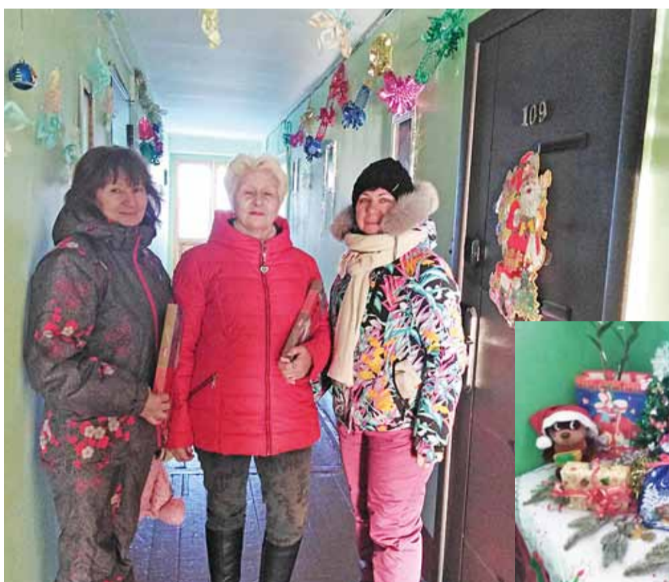
Украшением дворов и своих домов к Новому году в ТОСе «Совет микрорайона Мокрушинский» занимались жители всех возрастов