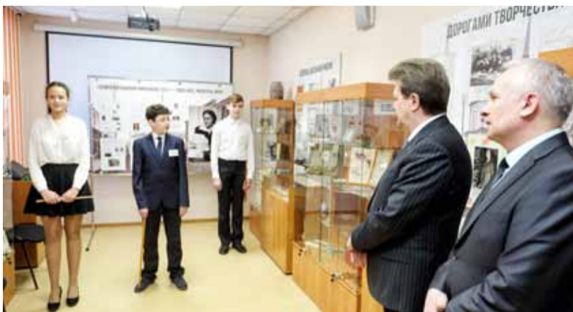
Для мэра Томска в школе № 15 приготовили небольшую экскурсию по отремонтированным помещениям