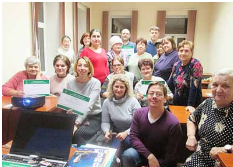
На обучающих семинарах занимаются томичи разных возрастов и профессий

Только за последние пять лет новые знания на семинарах получили