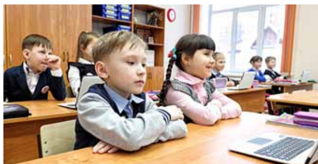
Для начальной школы приобрели две передвижные цифровые лаборатории, которые позволяют сделать изучение окружающего мира интересным и интерактивным