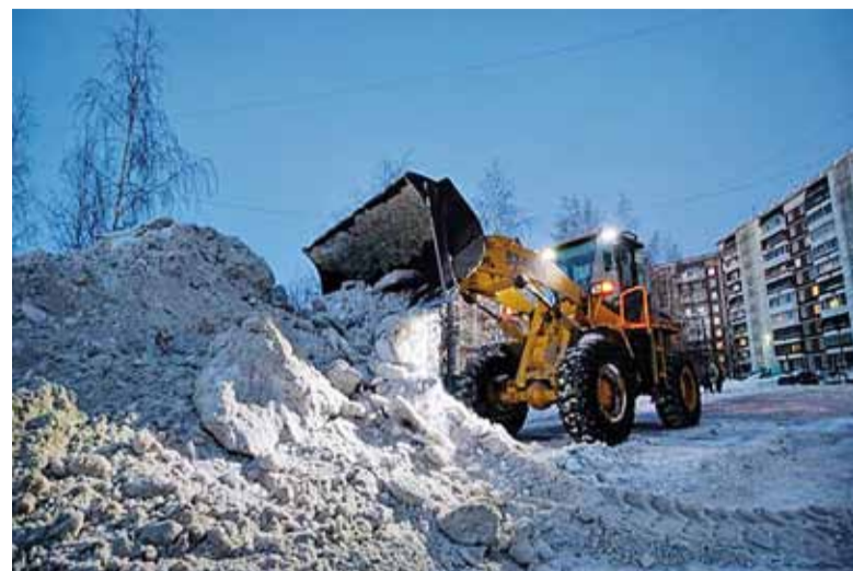
В томских дворах снег чистят спецтехникой и вручную

– Мониторинг обращений в единый центр показывает, что количество звонков по со-