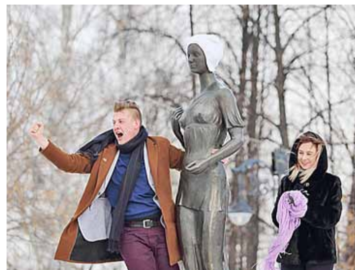
Каждый год изящную статую святой Татьяны студенты утепляют – надевают шапку и шарф