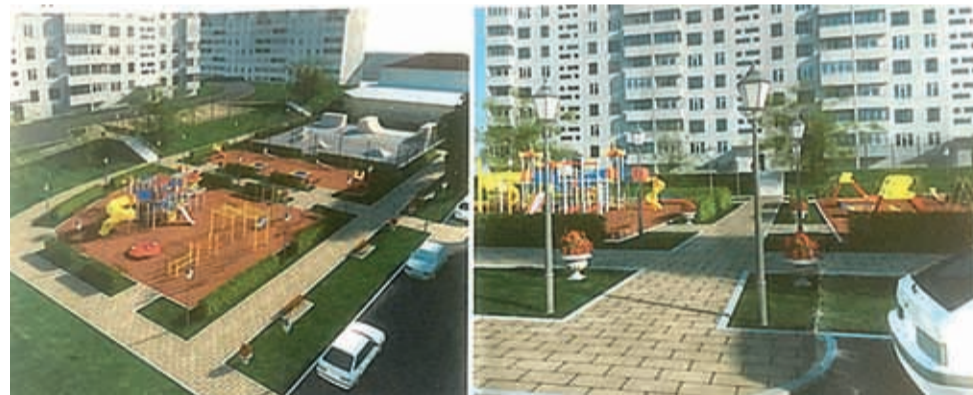
Такой будет спортивная площадка ТОСа «Иркутский»

– Мы с внуком часто ходим сюда играть, в нашем микрорайоне это пока