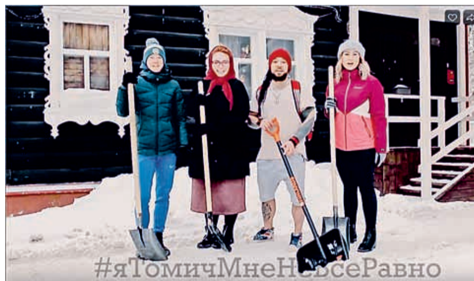
Участники акции «Я томич мне не все равно» помогли городу убрать снег во дворах

В уборке снега городу также помогли участники конкурса «Снежная вахта» и активная молодежь.