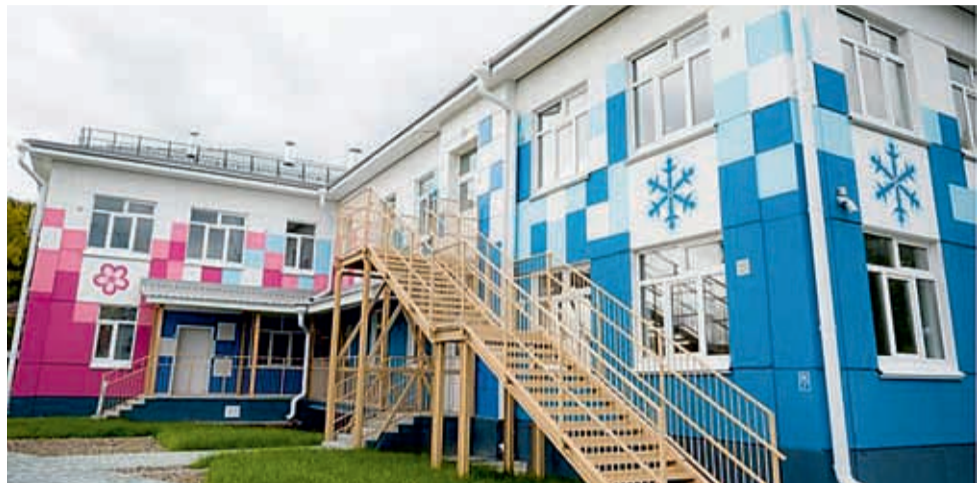
Детский сад на 145 мест в микрорайоне Радужном

Продолжилось благоустройство тропы здоровья на стадионе «Буревестник», с участием спонсоров оборудованы площадки для воркаута, открыт первый стритбольный центр.