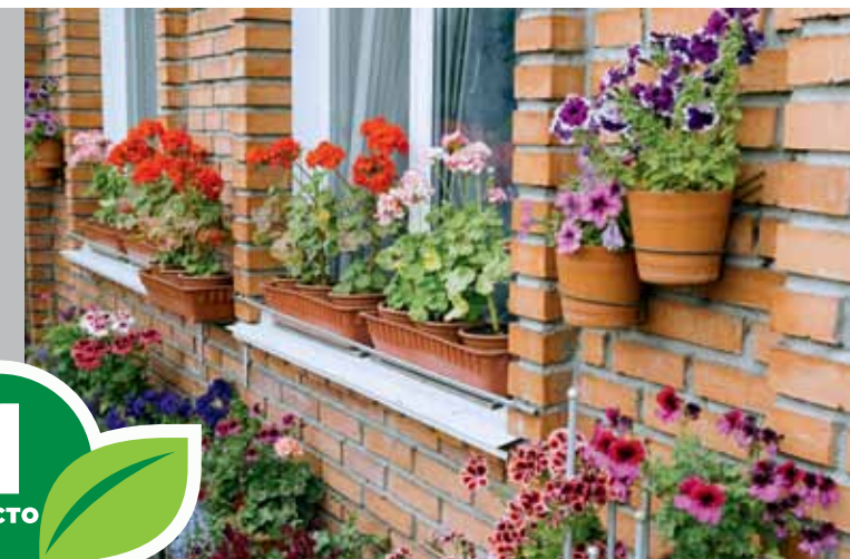
Пер. Стрелочный, 14