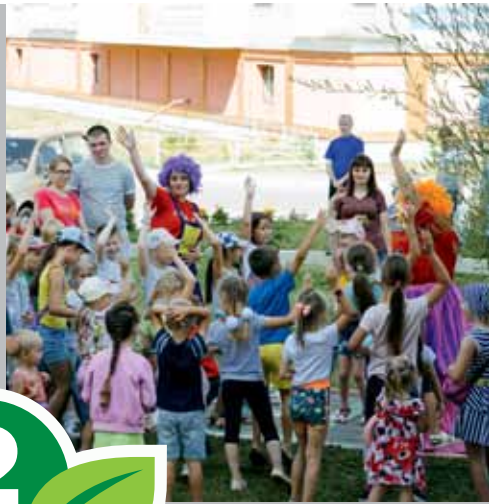
Ул. Герасименко, 1/16