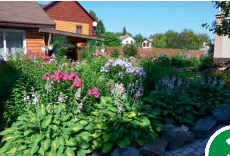
Ул. Бажова, 6