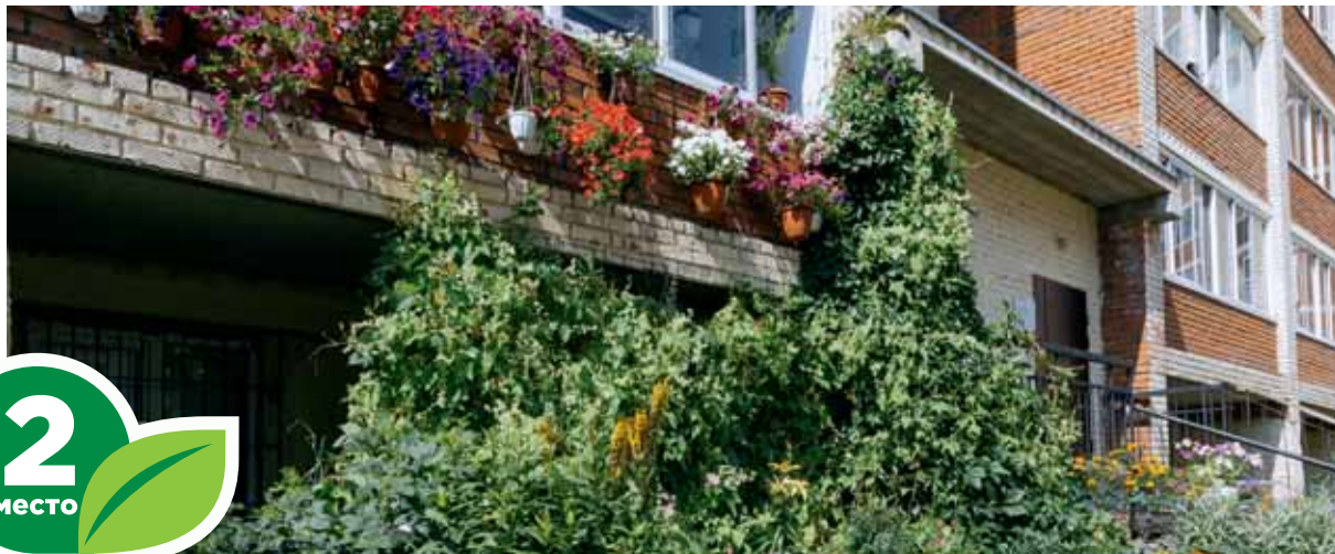
Ул. Б. Хмельницкого, 5/1, кв. 1