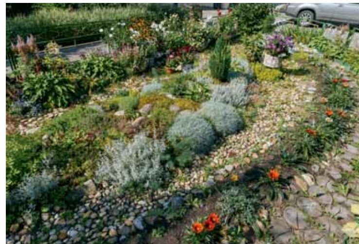
Ул. Герасименко, 1/14 («Лучший цветник, клумба»)

Главные популяризаторы конкурса «Томский дворик» собраны именно в этой номинации. «Заражают» своим примером жителей соседних дворов, не устают фантазировать и воплощать свои идеи год за годом, не останавливаются на достигнутом, а продолжают вдохновлять новых участников конкурса. В их дворы, подъезды, усадьбы можно заглядывать из года в год, там неизменно ухоженно и благоустроено. А оптимизм и желание горы свернуть подкупают и завораживают. Настоящая гордость Томска! Так, уже несколько лет в одном из томских подъездов можно на каждом этаже увидеть художественную роспись, вокруг многоэтажного дома в спальном районе обнаружить цветник со ста видами растений, а в одном из дворов в центре Томска можно попасть на новогоднюю уху, которую варят на улице и едят жители нескольких подъездов.