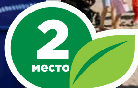
Ул. Сибирская, 33