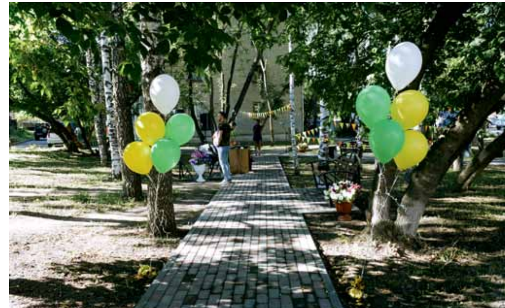
Сквер «Педагогический», ул. Киевская, 62