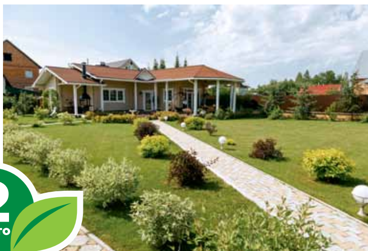
Пос. Апрель, проезд Саратовский, 4