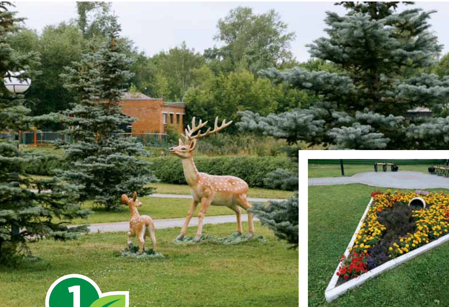
Сквер, ул. Петропавловская, 4