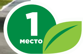
УФСИН России по Томской области, ул. Пушкина, 48