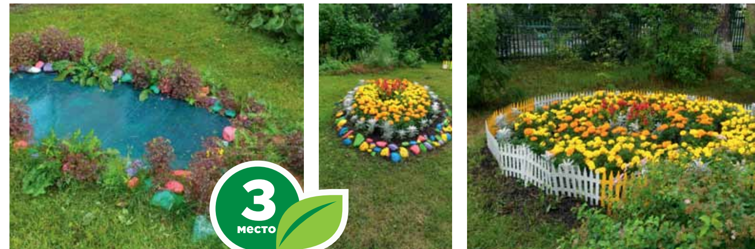
МАОУ ДО ДДТ «У Белого озера», ул. Кривая, 33