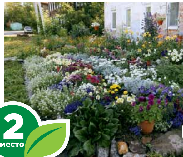
Ул. Максима Горького, 4