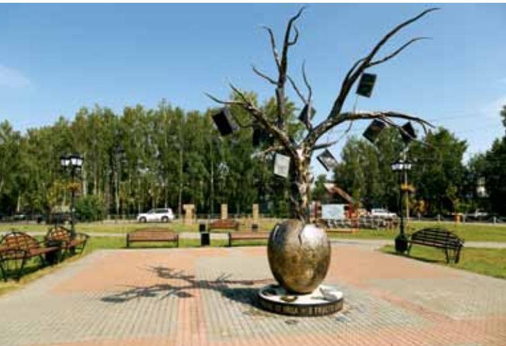
Сквер «Древо знаний», ТУСУР, ул. Вершинина, 74