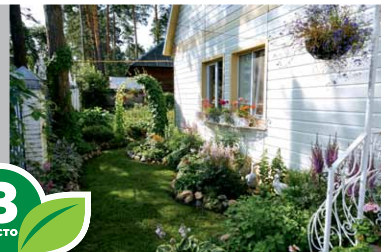
Село Тимирязевское, ул. Тенистая, 28