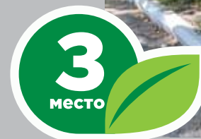
ОГАУЗ «Медико-санитарная часть «Строитель», пр. Фрунзе, 218