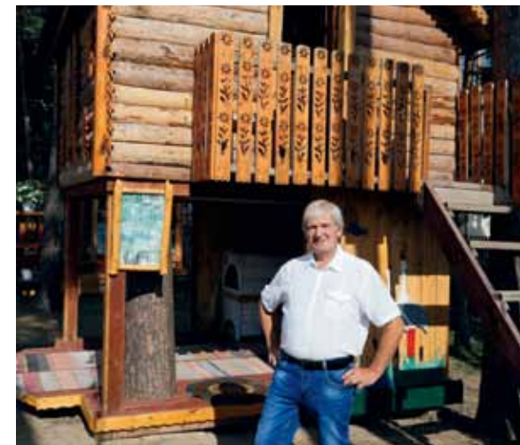
Детский городок «Свечка», ул. Амурская, 37