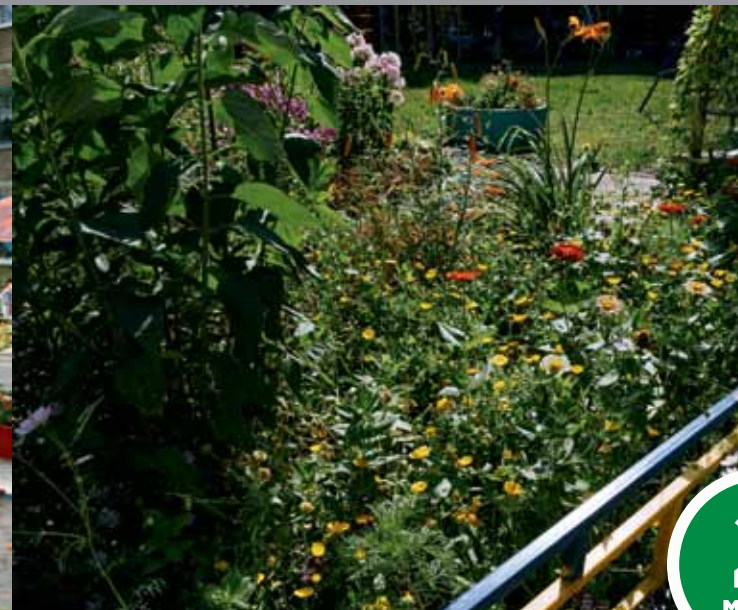
Ул. Нахимова, 15