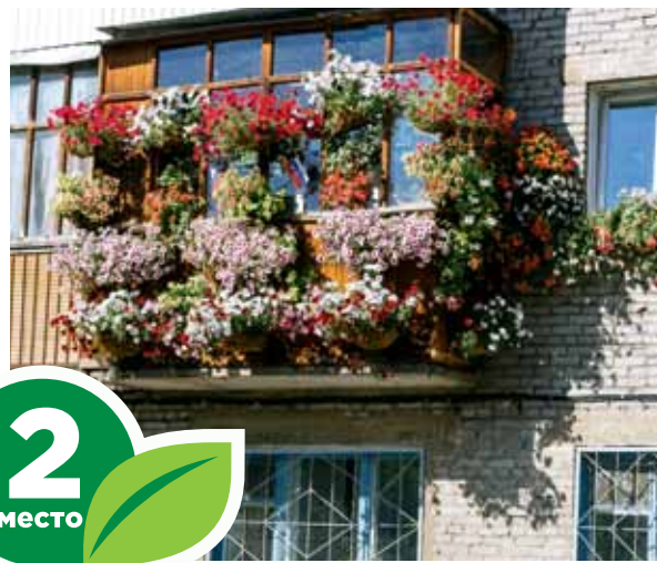
Ул. Новгородская, 20, кв. 85