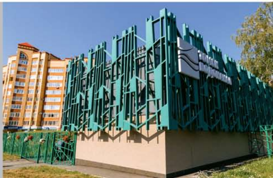
Водонапорная станция третьего подъема № 2, ул. Красноармейская, 142