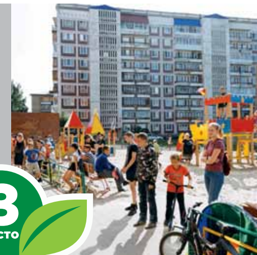
ул. Иртышская, 21, Совет дома – ООО УК «ЖЭП № 9»