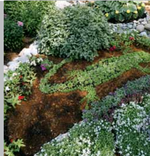
Ул. Елизаровых, 4 («Лучший цветник, клумба»)