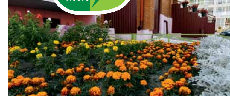
Пер. Курганский, 5