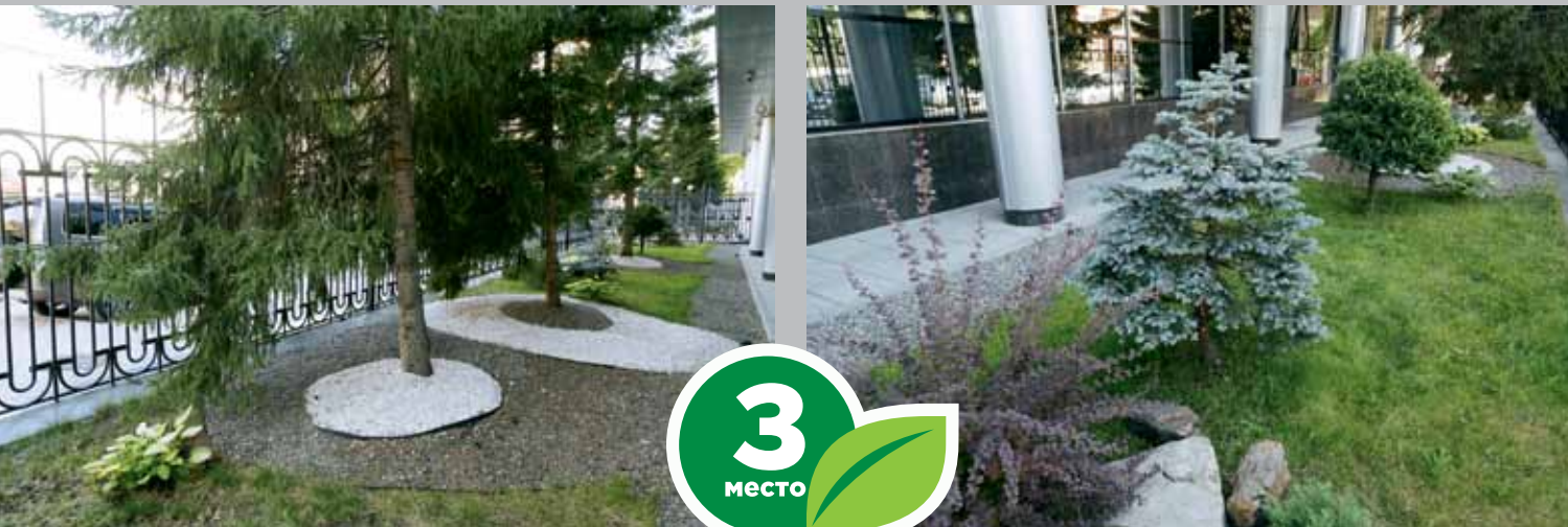
ОАО «Востокгазпром», ул. Большая Подгорная, 73