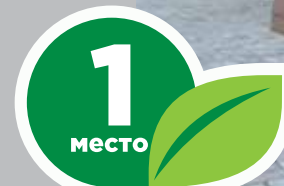
ООО «Дом-Сервис ТДСК», пер. Нечевский, 10