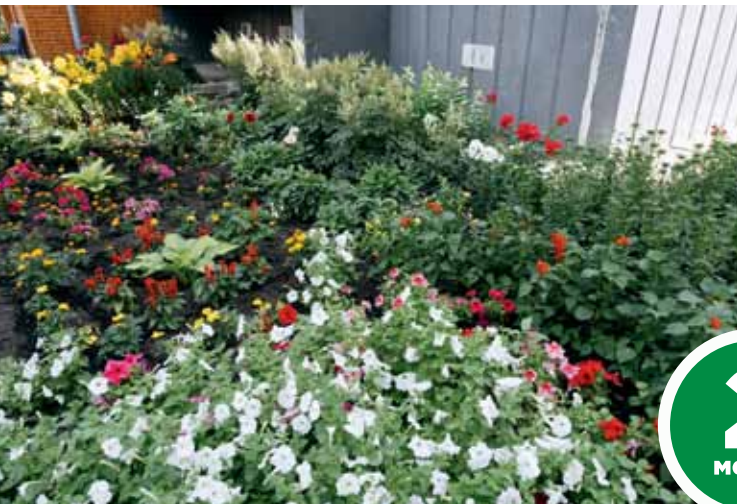
Ул. Ивана Черных, 34