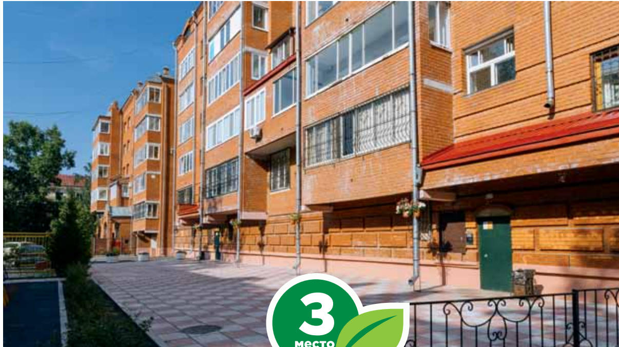
ул. Кузнецова, 5