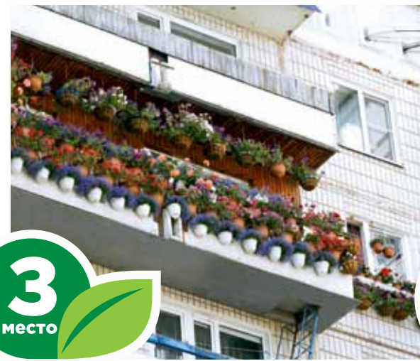
Ул. Новосибирская, 37, кв. 196