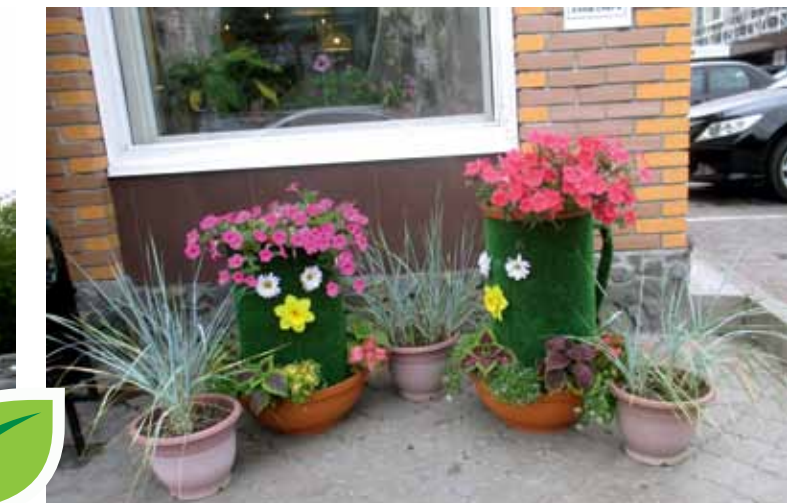
Трактир «Золотая долина», пр. Ленина, 121а