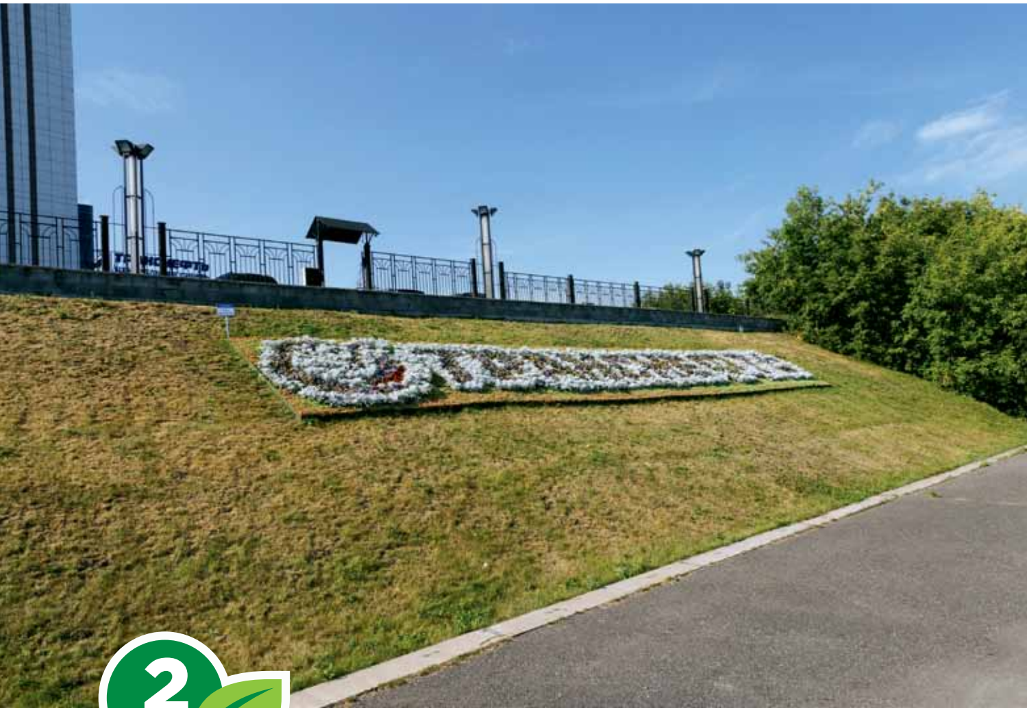
Клумба, ул. Набережная реки Ушайки, 24