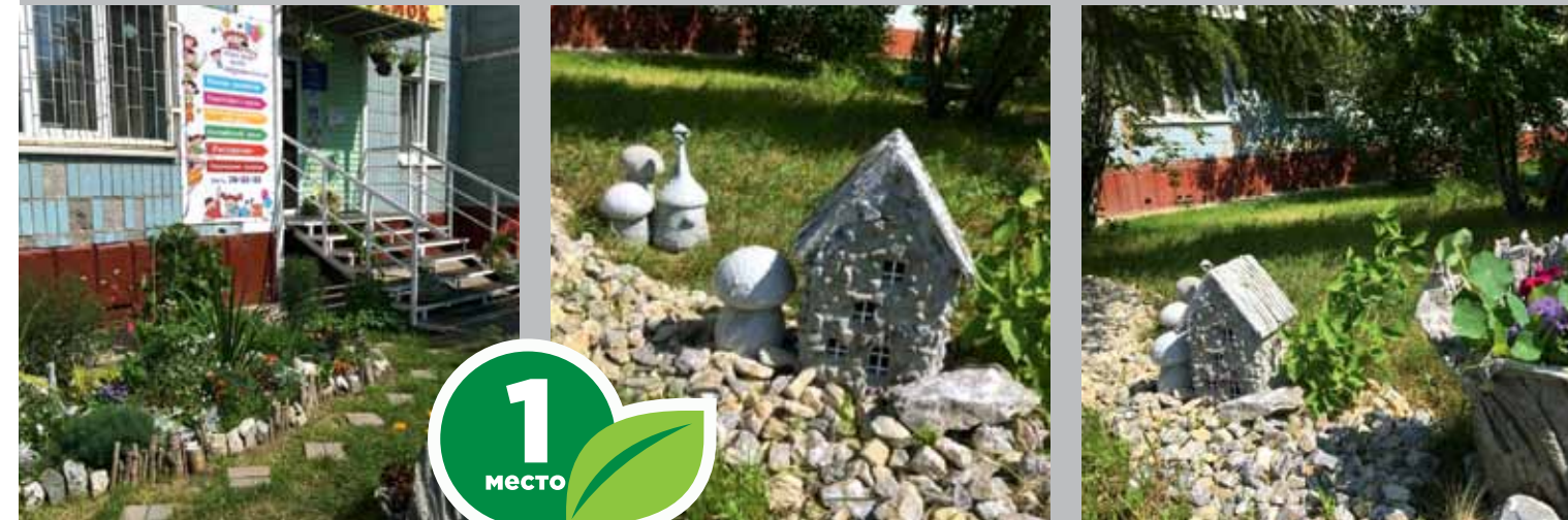
МБОУ ДО ДДТ «Искорка», пр. Мира, 31

Выдержанный дизайнерский стиль, яркость и цветочные ароматы встречают юных томичей на входе в городские учреждения дополнительного образования. Все композиционные решения гармонируют друг с другом и являются благоухающими островками в своих микрорайонах. Чудесные преобразования происходят даже с территориями, которые не принадлежат учреждениям дополнительного образования, а являются общегородскими. В этом году такие есть и среди победителей нашего конкурса.