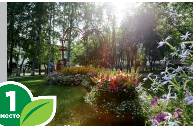
ОАО «ТДСК», ул. Елизаровых, 79/1