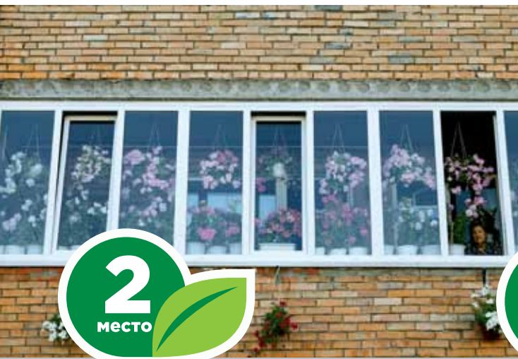
Ул. Тверская, 90, кв. 8