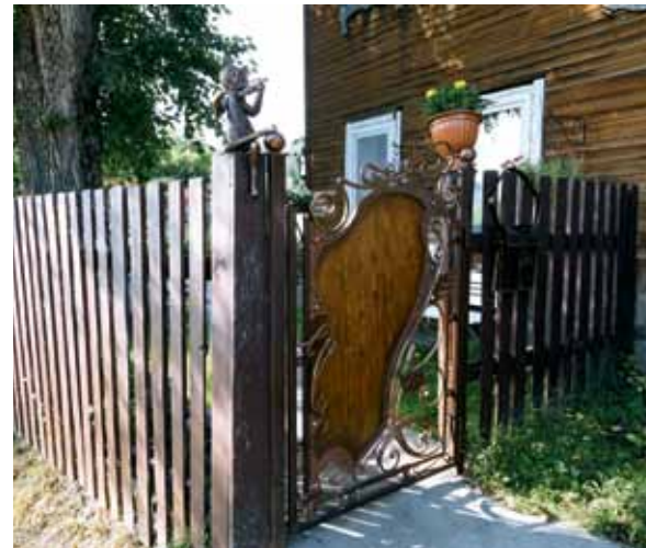
Кованые кружева, ул. Яковлева, 91