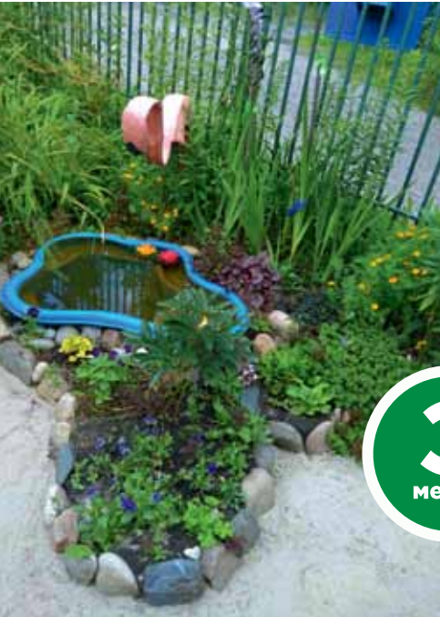
МБДОУ № 27, с. Тимирязевское, Крылова, 15