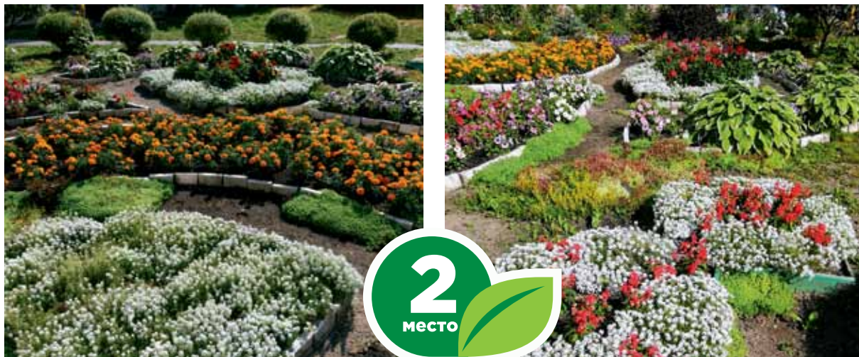
Ул. Иркутский тракт, 39/1