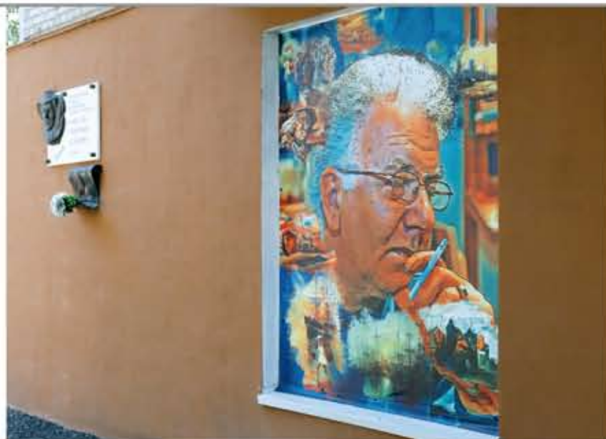
Мемориальная доска художнику Рафаэлю Асланяну, ул. Карташова, 68