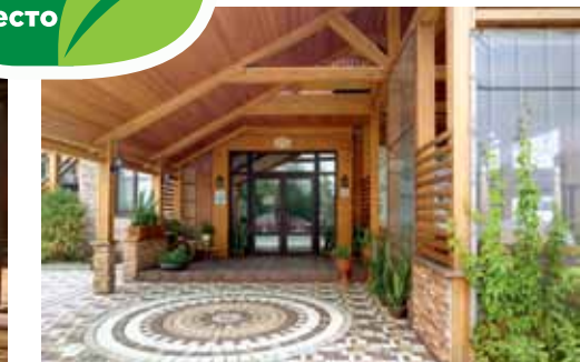
Кафе Гостевой дом «Шале», пер. Мариинский, 40/2