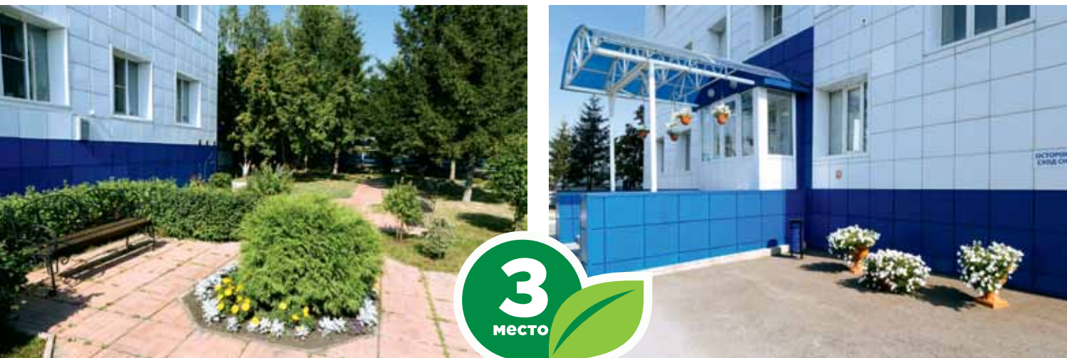
ООО «Газпром трансгаз Томск», филиал Управление материально-технического снабжения и комплектации, ул. Причальная, 13