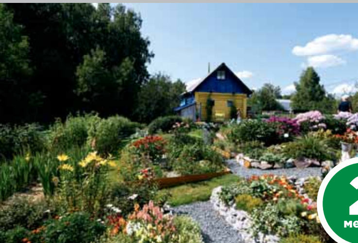
Пос. Светлый, мкр. Реженка, ул. Центральная, 27