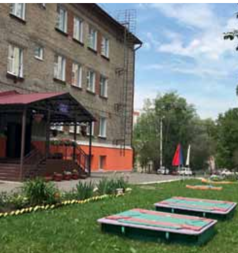
МБОУ ООШИ № 22 г. Томска, ул. Сибирская, 81г