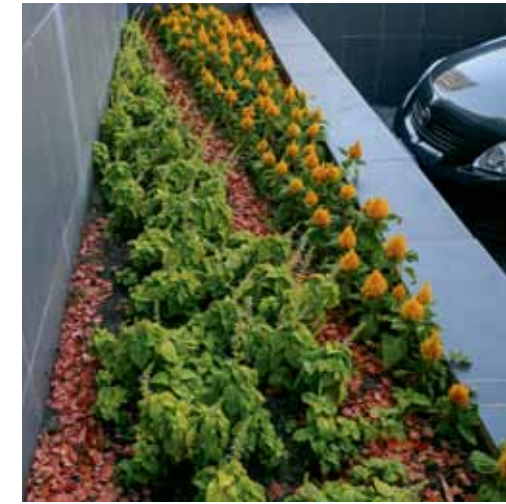
Ул. Челюскинцев, 2