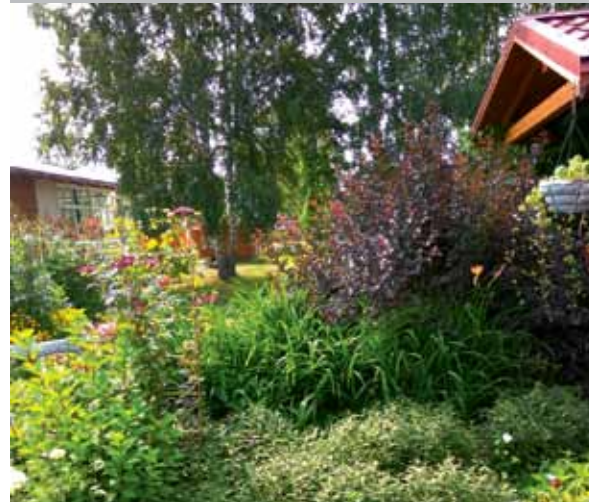
Ул. Шаляпина, 23 («Лучшая частная усадьба»)