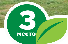
Сквер, пр. Кирова, 56а