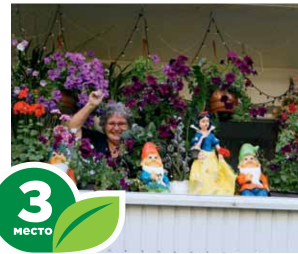
Ул. Иркутский тракт, 27/1, кв. 80