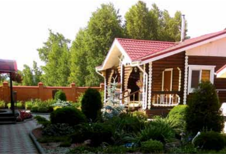
Ул. Ясная, 15 («Лучшая частная усадьба»)