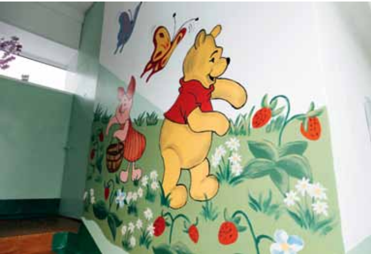
Ул. Говорова, 86, подъезд № 1 («Подъезд образцового содержания»)