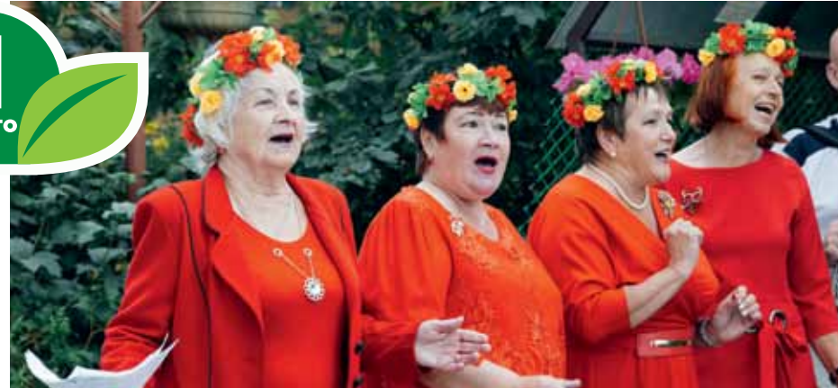
Ул. Профсоюзная, 16/2