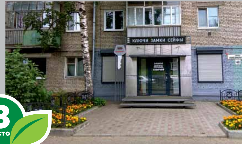
ООО «Ключ-Сервис», пр. Комсомольский, 49