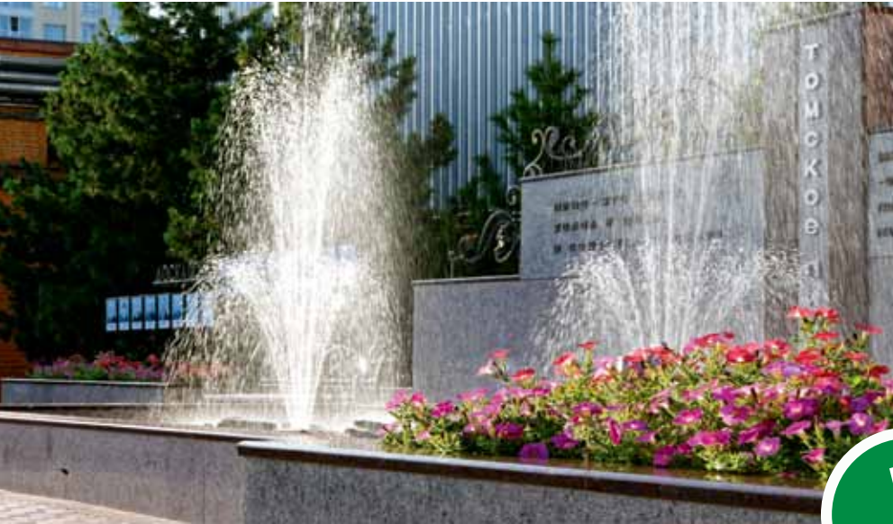
ОАО «Томское пиво», ул. Московский тракт, 46