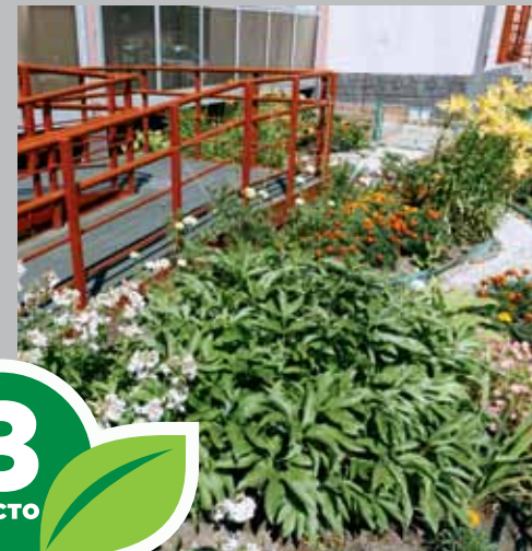
Ул. Нефтяная, 7