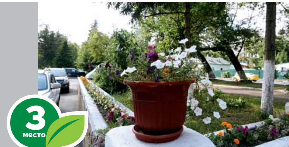
Управление федеральной службы по ветеринарному и фитосанитарному надзору по Томской области, пр. Фрунзе, 109а