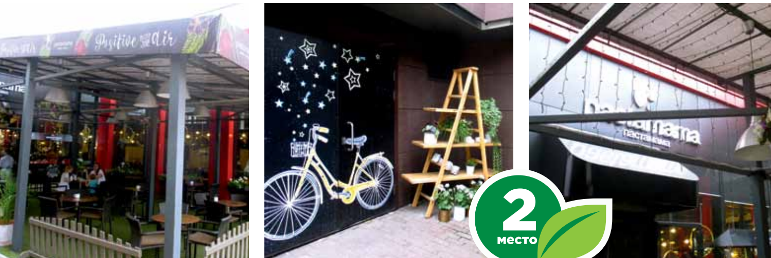
Кафе «Хуторок», ул. Мечникова, 12