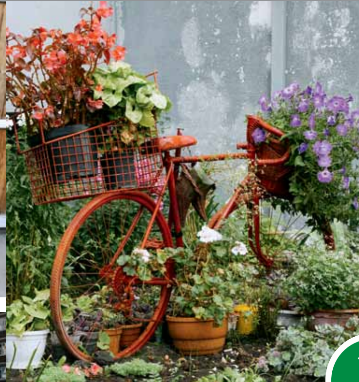
Ул. Дальне-Ключевская, 16а