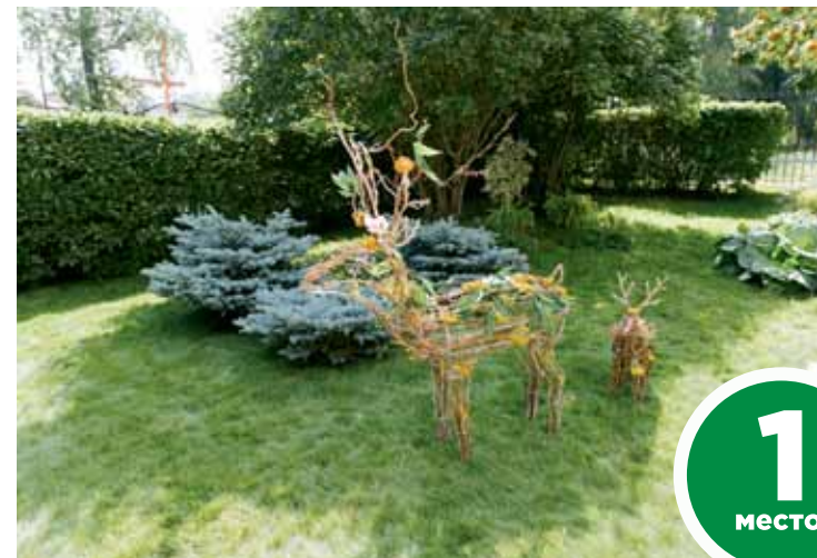
Корпоративный институт ООО «Газпром трансгаз Томск», ул. Барнаульская, 7

Как мотивировать сотрудников с хорошим настроением приходиться на работу? Ответ на этот вопрос знают участники номинации на самую благоустроенную территорию офиса. Решение простое – создавай уют и комфорт для коллектива, начиная с уличной территории, и люди к тебе потянутся. Не только сотрудники, но и клиенты, бизнесмены, инвесторы. Разбудить чувство прекрасного в них способны креативные и ухоженные клумбы, выделенные зоны отдыха для работников, наличие освещения и урн, а также разнообразные садово-парковые скульптуры, подчиненные общему стилю. Именно территории офисов смогли продемонстрировать, как практично и в то же время творчески можно зонировать пространство, предупреждая все потребности сотрудников. В этом плане впечатляют беседки, необычные задумки с фонтанами, экзотические деревья и растения. Одни компании ищут подходящие ландшафтные решения сами, другие доверяют эту работу профессионалам. Некоторые же умудряются даже саму территорию и двор офиса сделать брендом, символом не только компании, но и всего города.