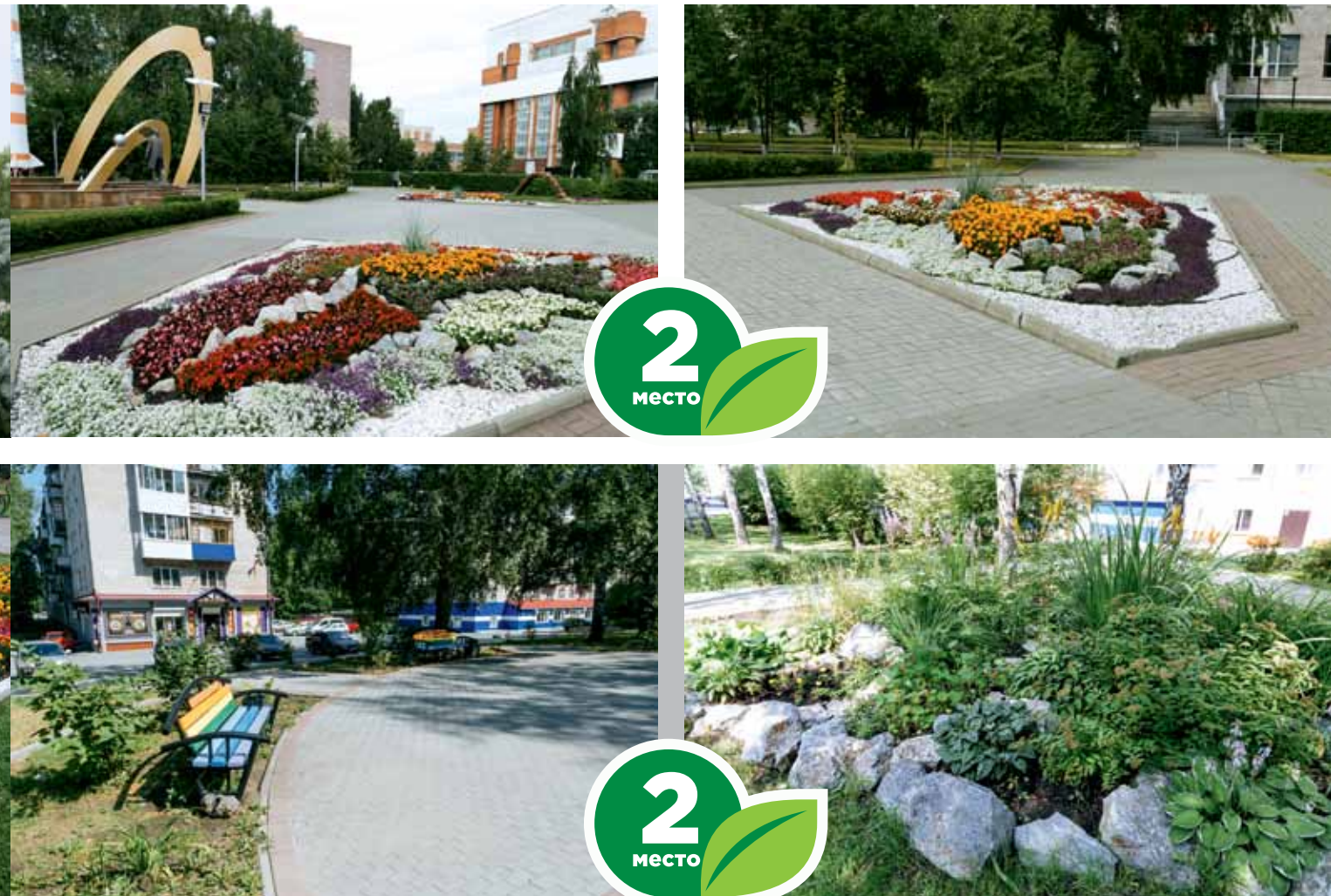
Сквер, ул. Мокрушина, 12, 12а, 14, 14/1