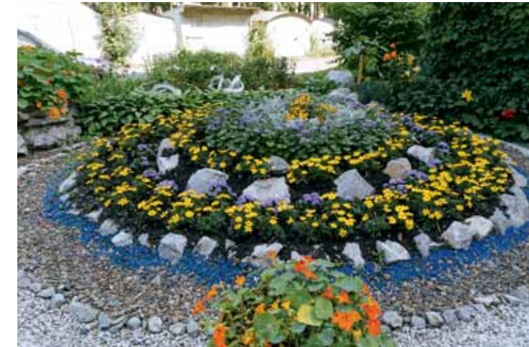
Ул. Мокрушина, 13 («Двор образцового содержания»)