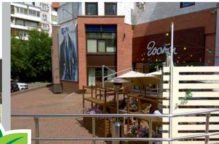
Кафе «Гости», пр. Фрунзе, 90