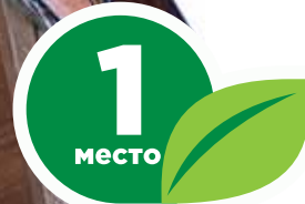
Ул. Октябрьская, 48, кв. 4