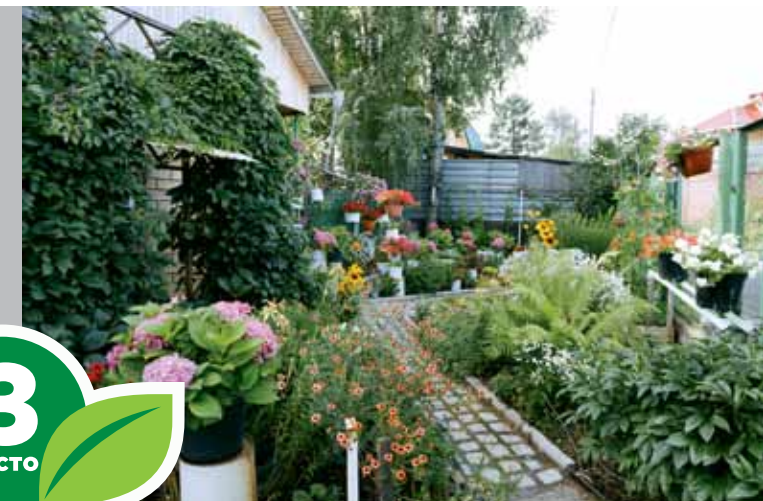
Пос. Берлинка, ул. Камышовая, 29а