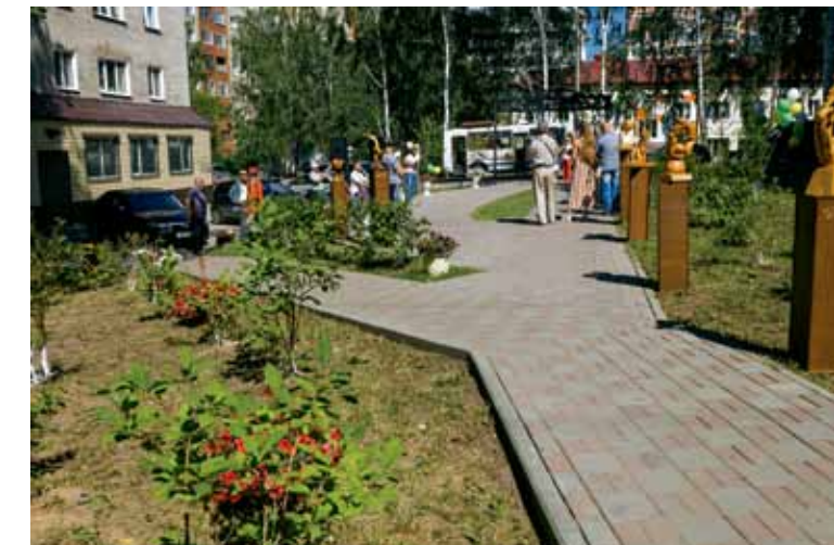
«Сквер Леонтия Усова», ул. Алтайская, 105