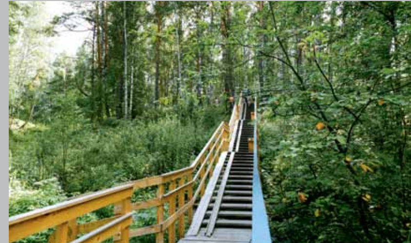
Родник, пос. Светлый, 46

Самая непредсказуемая номинация конкурса. Не имеет ограничений, дает полет фантазии, открывает пространство для творчества. Позволяет каждому томичу заявить о себе и своей любви к городу и его истории. В этом году многообразие объектов впечатляет и радует: родник, скверы, цветники, детский городок, мемориальная доска, водонапорная станция и даже кованые кружева. Лучших выбрать просто невозможно, победители – все. Отличный старт!