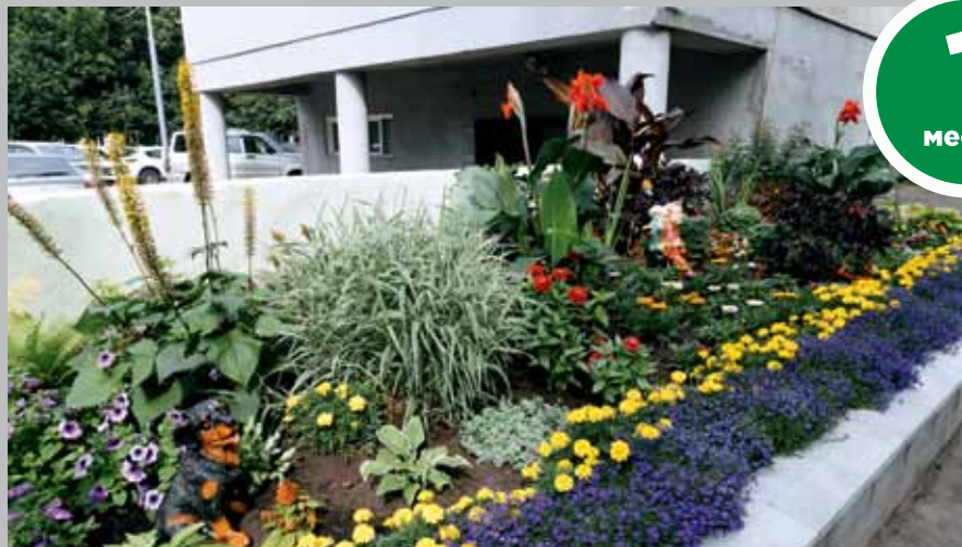
Отделение Пенсионного Фонда России по Томской области, пр. Кирова, 41/1