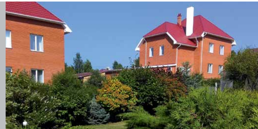
Ул. Ясная, 13а («Лучшая частная усадьба»)