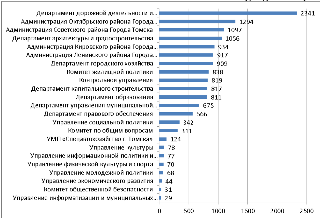
Диаграмма 3. Количество поручений, исполненных органами администрации и структурными подразделениями.

По итогам рассмотрения обращений: каждое 6 обращение рассмотрено с участием заявителей либо с выездом на место (1247), по 320 – приняты положительные решения или меры по удовлетворению законных требований заявителей, по 7114 – даны разъяснения, по 3 – принято решение об отказе в удовлетворении требований заявителей как незаконные, 177 – направлены по компетенции в органы государственной власти и прочие инстанции.