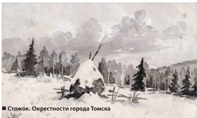
■ Стожок. Окрестности города Томска