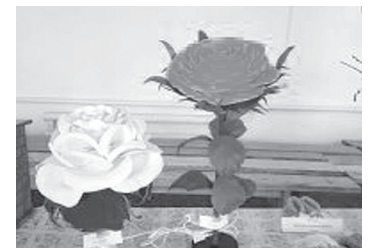
■ Светильник-ночник. Щербак Л.Б.

Чтобы всё, о чем мечталось, в жизни каждый раз сбывалось.