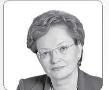
Оксана Козловская , председатель Законодательной Думы Томской области